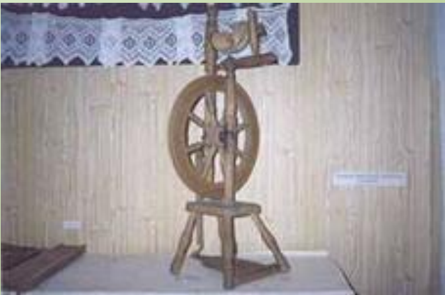
Пряха за прялкой