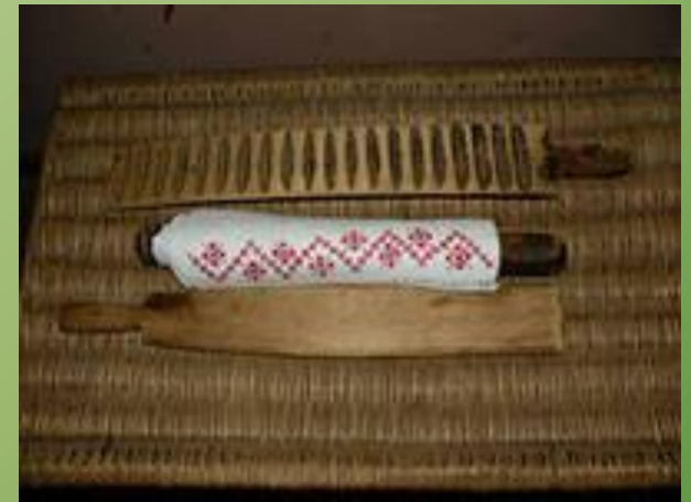
Так гладили белье