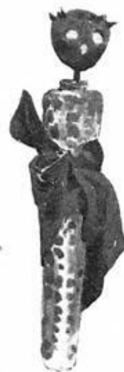
Игрушка из Гаскони, сдѣланная изъ кукурузы.