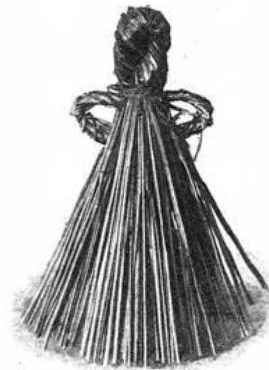
Кукла изъ соломы Тамбовской г. Колл. Моск. Рум. музея.