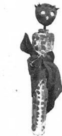
Игрушка из Гаскони, сдѣланная изъ кукурузы.