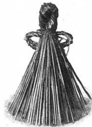
Кукла изъ соломы Тамбовской г. Колл. Моск. Рум. музея.