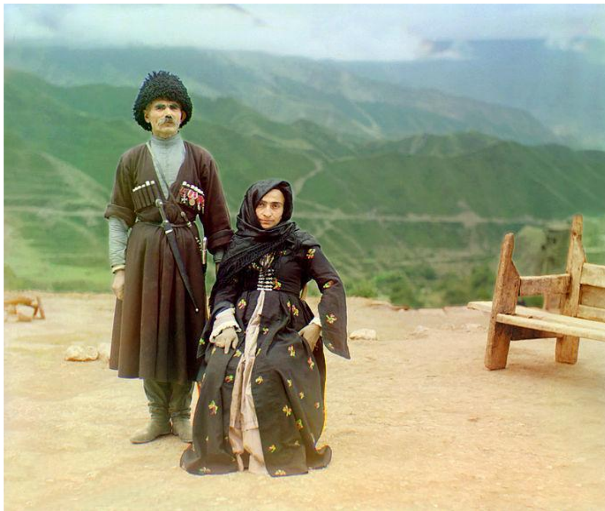
Дагестанцы, фотография начала XX века