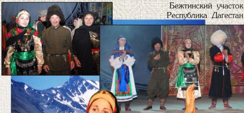
Бежтинский участок Республика Дагестан