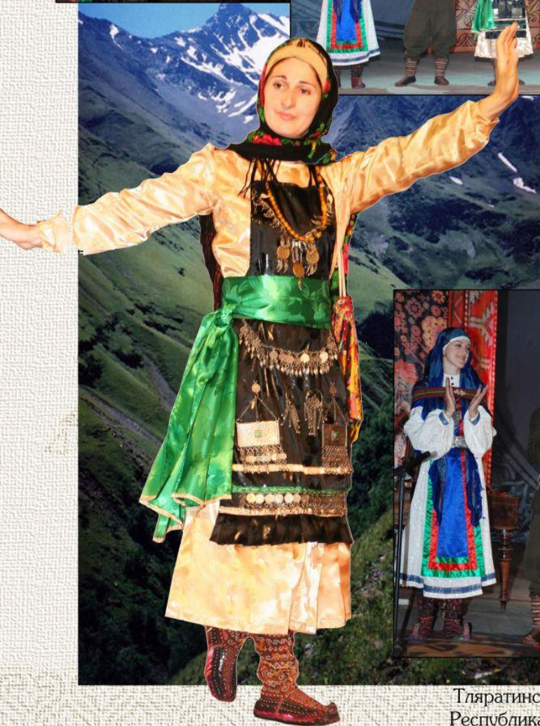
Тляратинский район Республика Дагестан