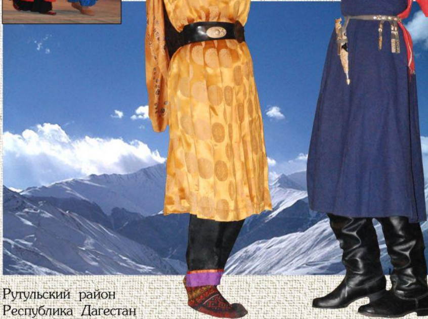
Рутульский район Республика Дагестан