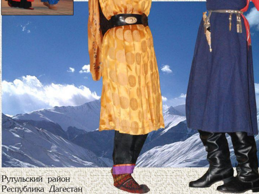
Рутульский район Республика Дагестан