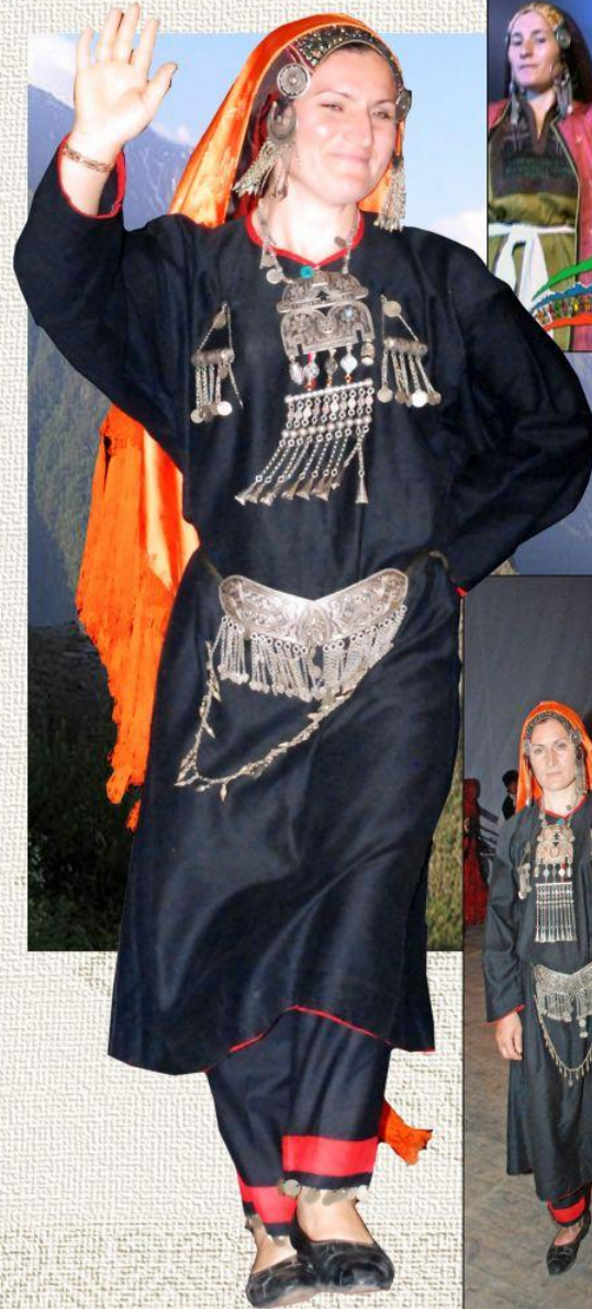
Шамильский район Республика Дагестан