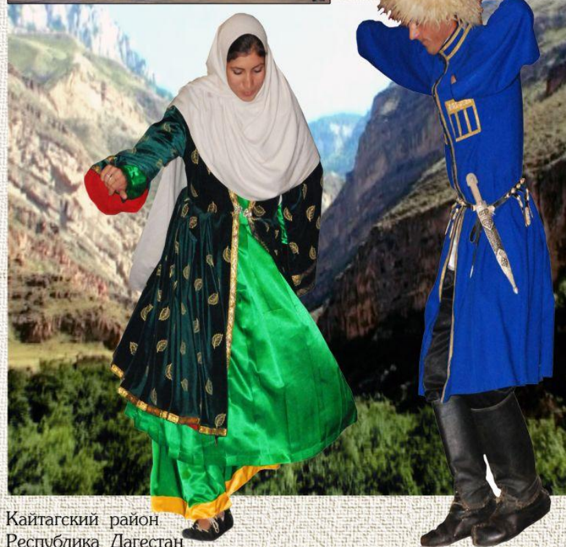
Кайтагский район Республика Дагестан