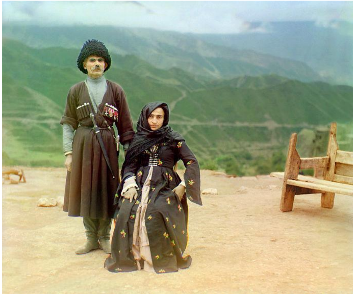
Дагестанцы, фотография начала XX века, С. М. Прокудина- Горского