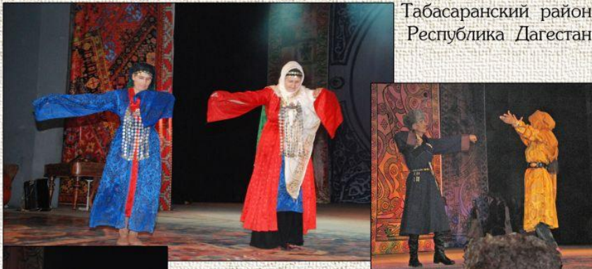
Табасаранский район Республика Дагестан