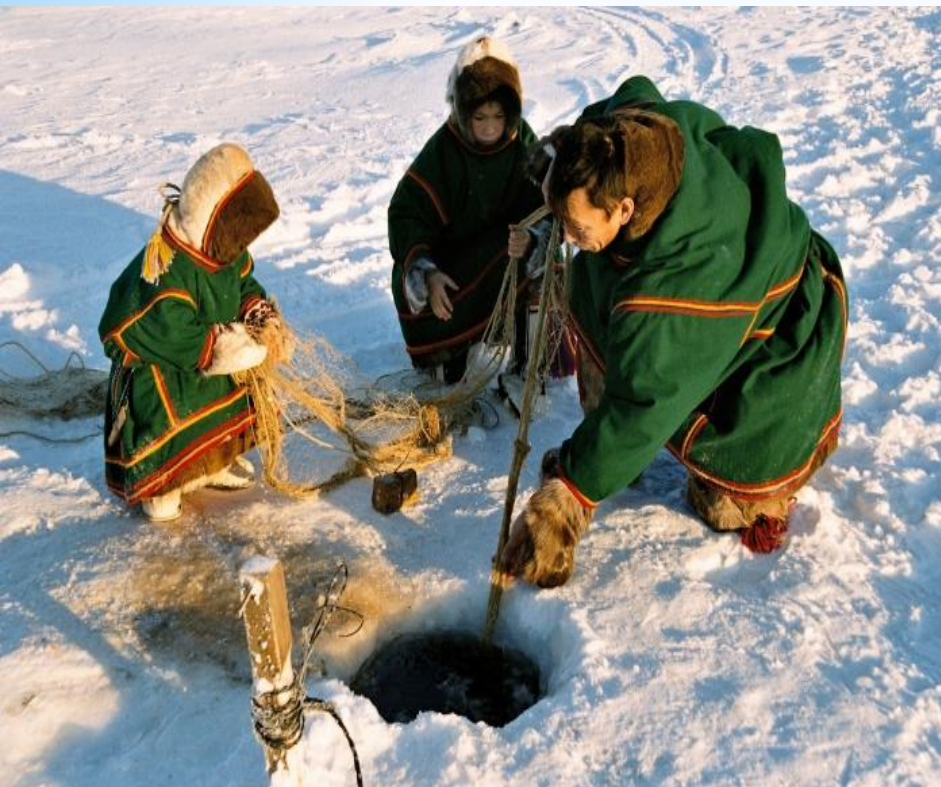
Рабочий день МАНСИ