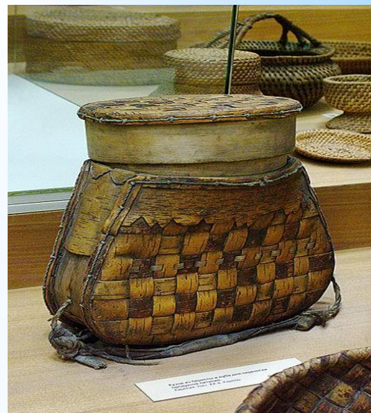
Кузов из бересты