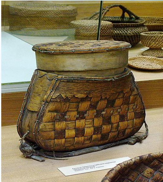
Кузов из бересты