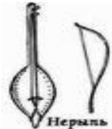
Нерыпъ- скрипка манси