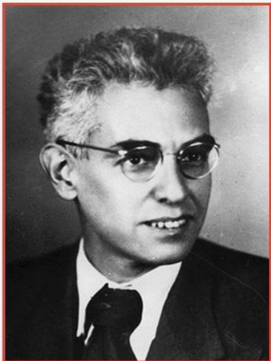
АЛЕКСАНДР РОМАНОВИЧ ЛУРИЯ (16.07.1902 - 14.08.1977)