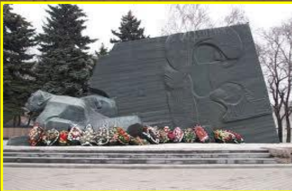
Памятник Славы. Мемориальный комплекс на братской могиле воинов Советской Армии, погибших в боях за Воронеж во время Великой Отечественной войны в 1942—1943 годах. Установлен в северном микрорайоне.