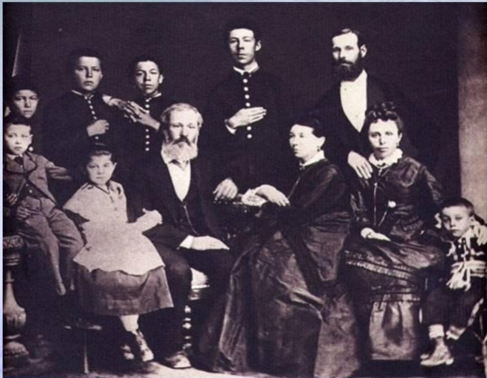
Семья Чеховых. Фото 1874. Таганрог