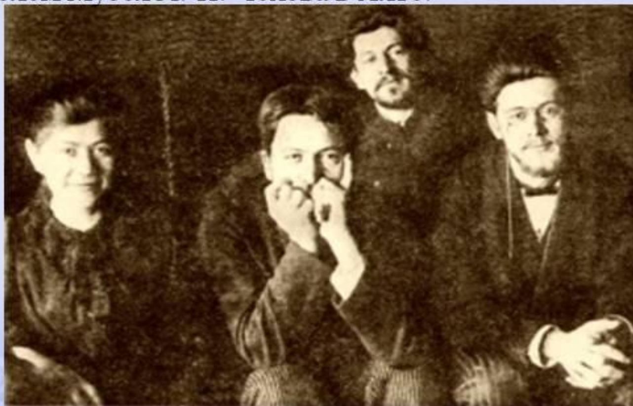
Сестра и братья Чеховы: Мария, Антон, Иван, Михаил. Фото 1892. Мелихово

Природа богато одарила детей Чеховых. Александр и Михаил так же, как и Антон, стали литераторами, Николай — художником, Иван — оставил добрую память, будучи учителем. Мария Павловна , прожившая самую долгую жизнь, была и художницей, и мемуаристкой, создателем и хранителем Музея А. П. Чехова в Ялте.