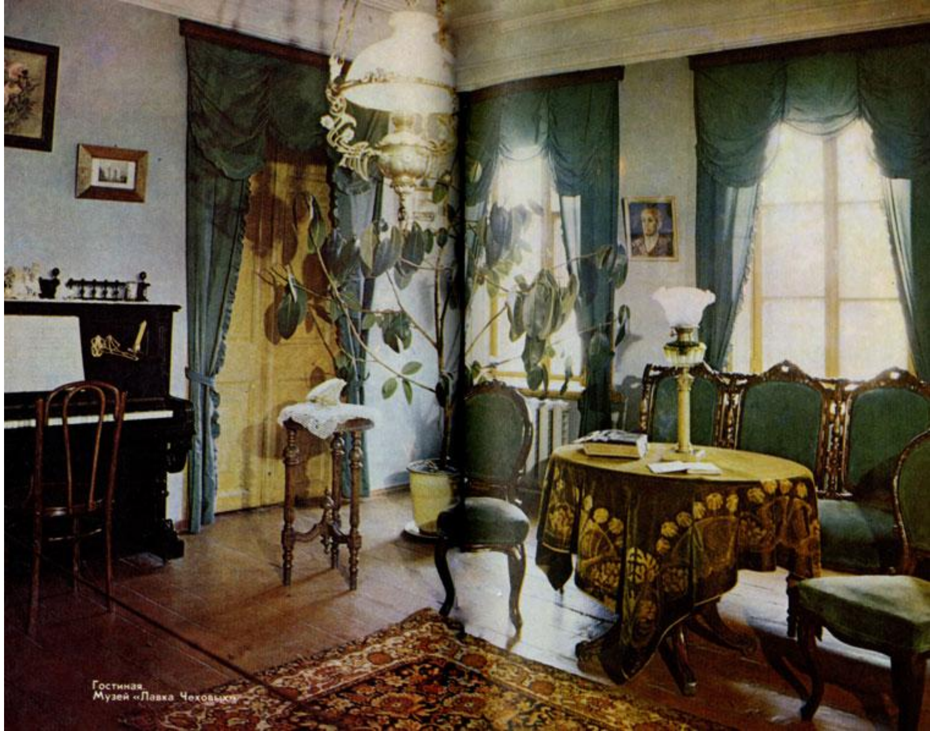
Гостиная. Музей «Лавка Чеховых»