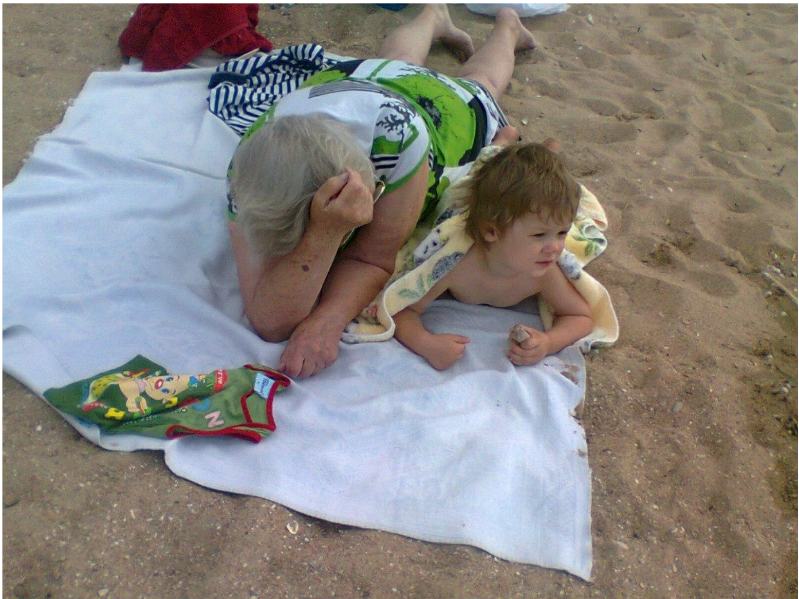
Водила нас на море