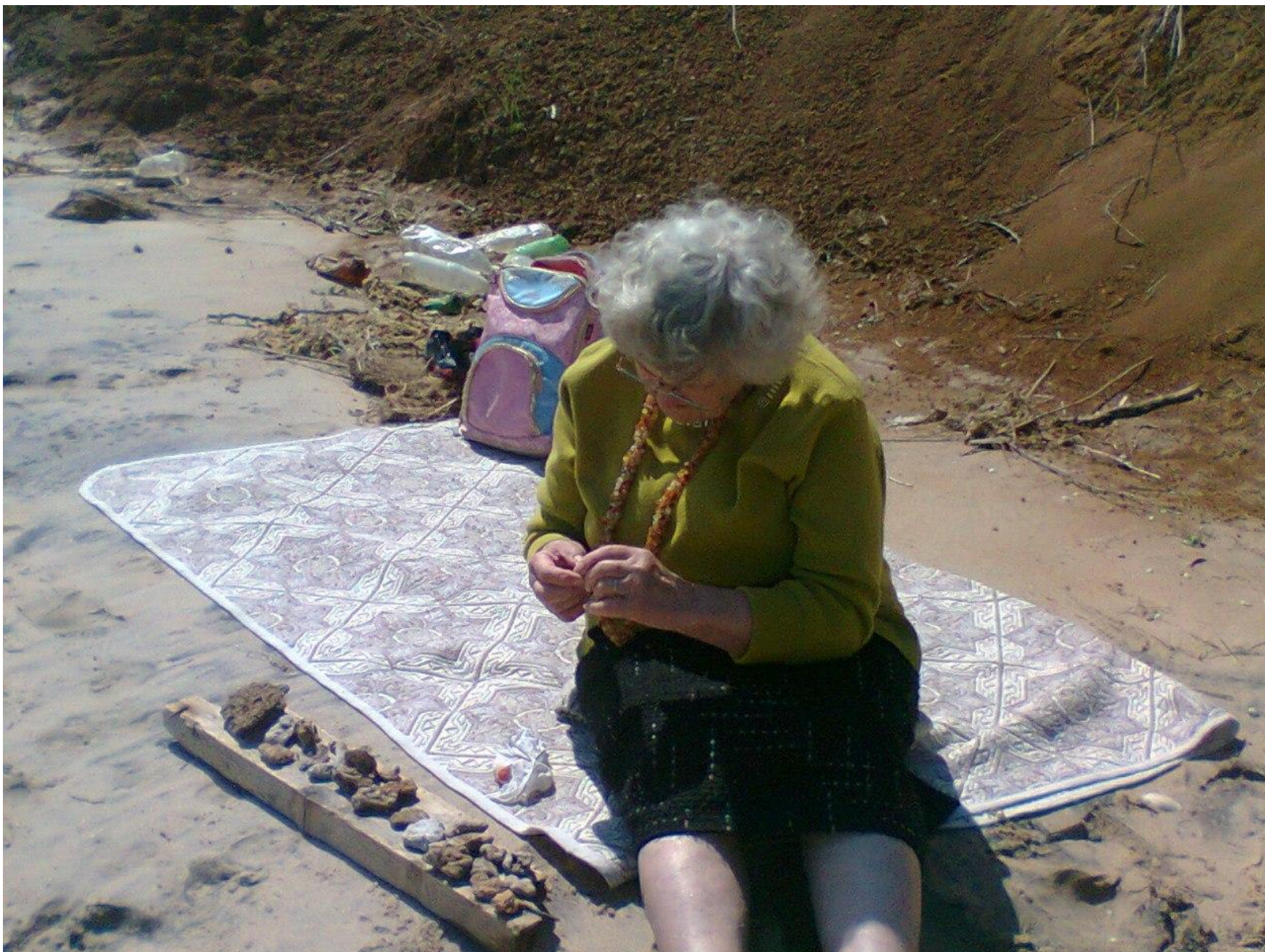
Все помнят камушки, которые она собирала