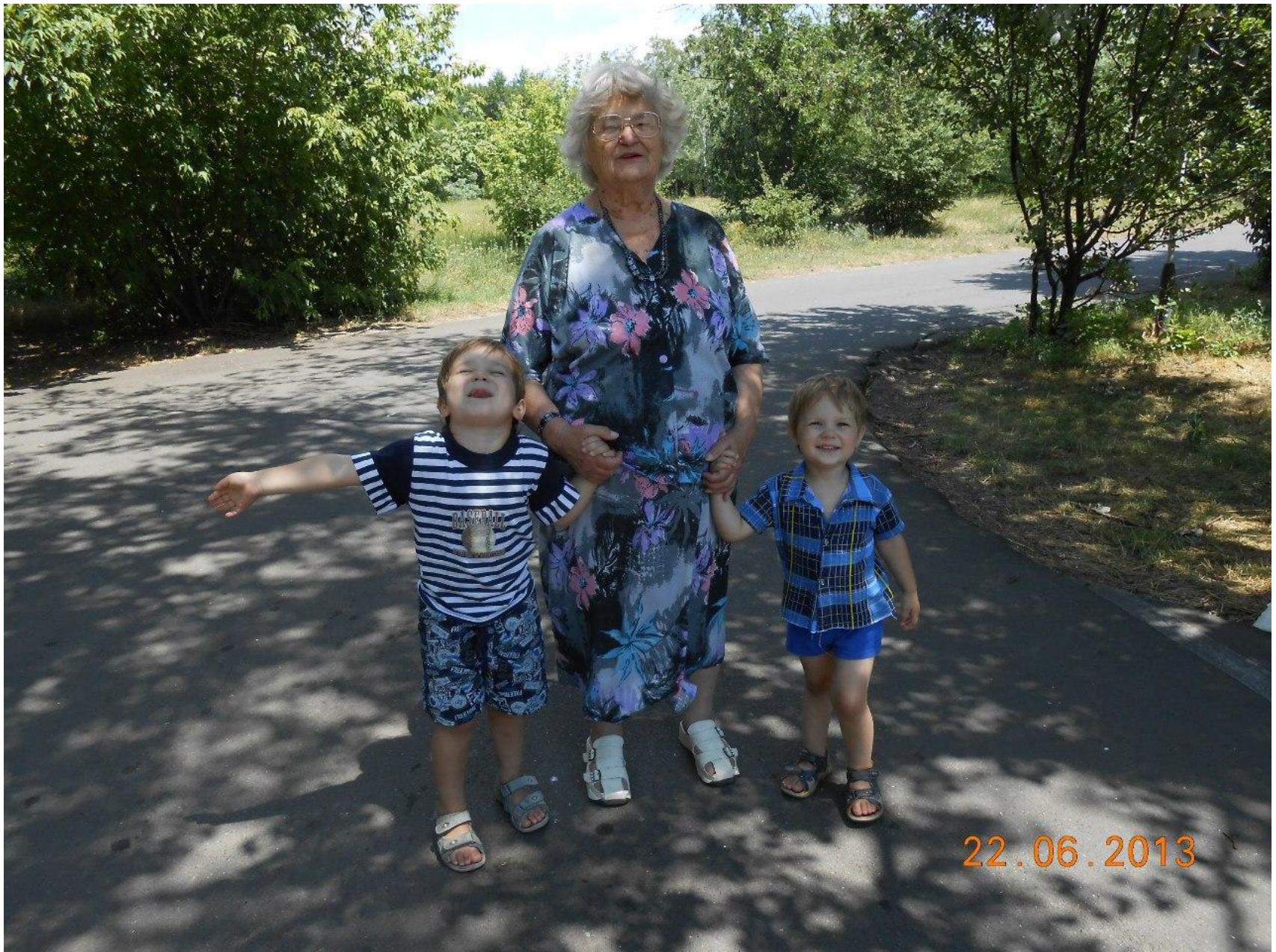
Бабушка часто гуляла с нами по парку