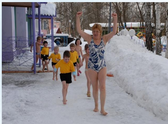
ХОЖДЕНИЕ БОСИКОМ ПО СНЕГУ