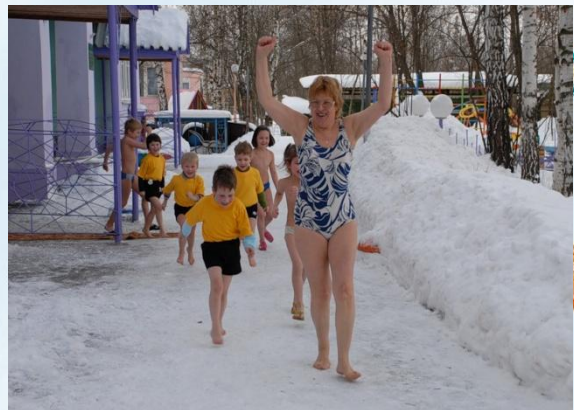
ХОЖДЕНИЕ БОСИКОМ ПО СНЕГУ