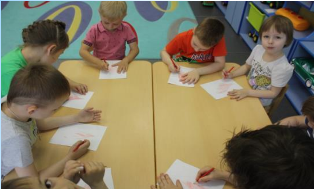
Рисуем символ донора