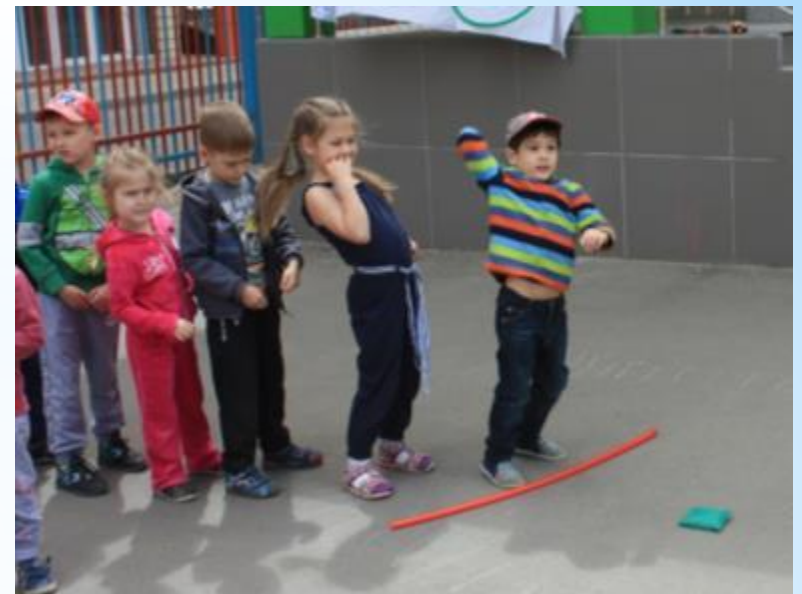
Олимпийское пятиборье: Метание диска (мешочков с песком)