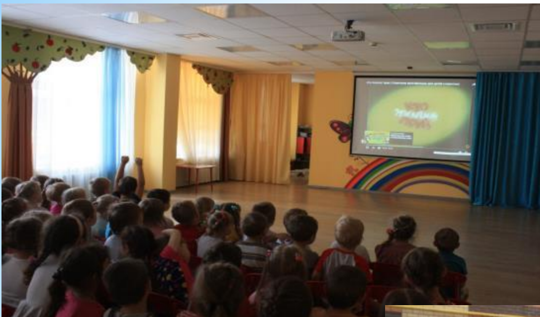
Просмотр мультфильма «Кто получит приз»