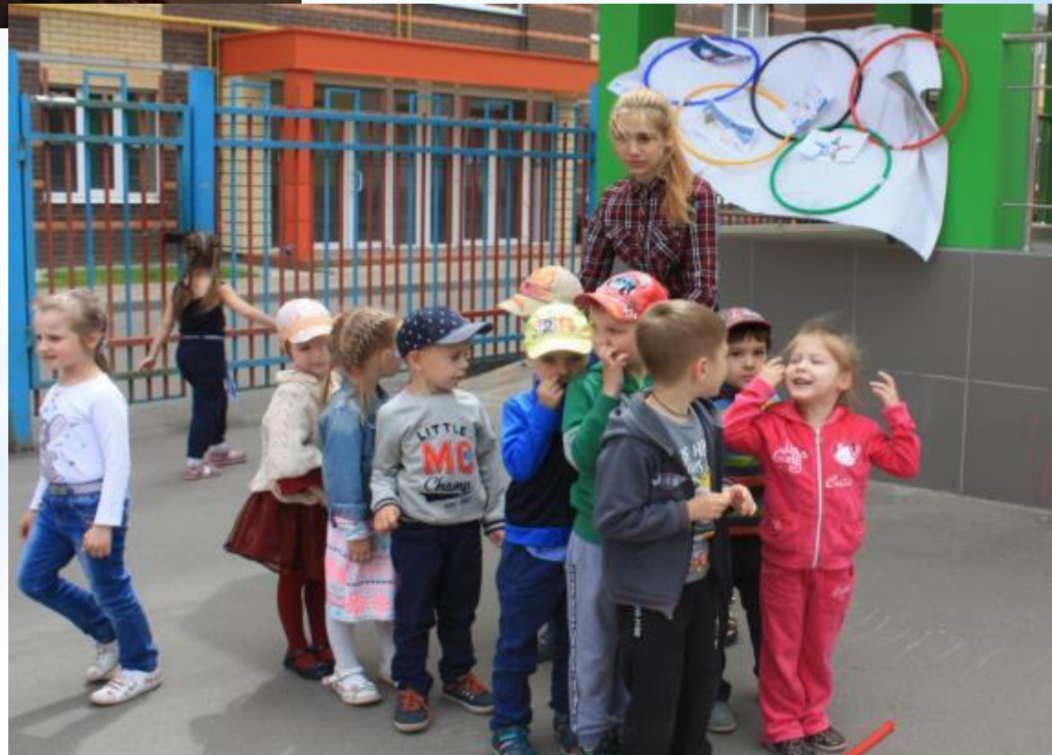
Торжественное открытие летних олимпийских игр