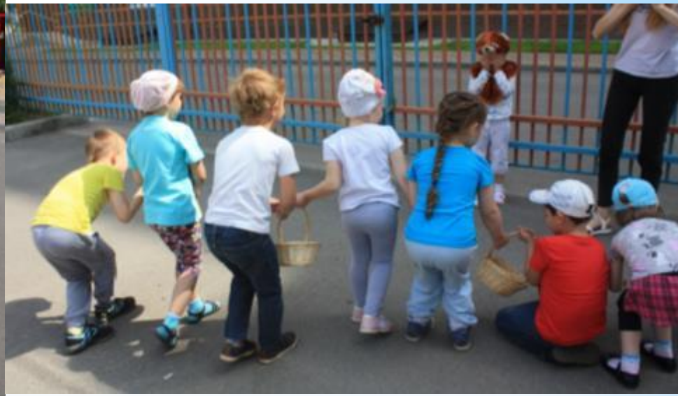
Подвижная игра «У медведя во бору»