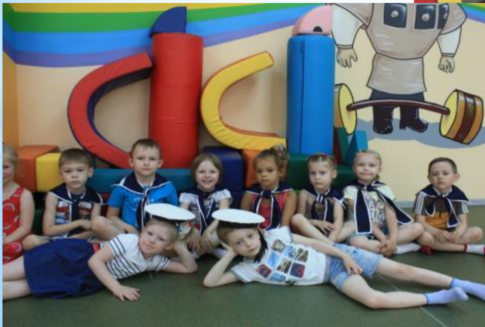
4. Строительство корабля из мягких модулей.