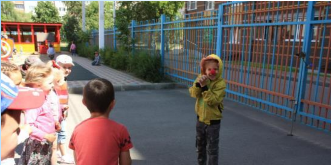
«Акулы и мальки»