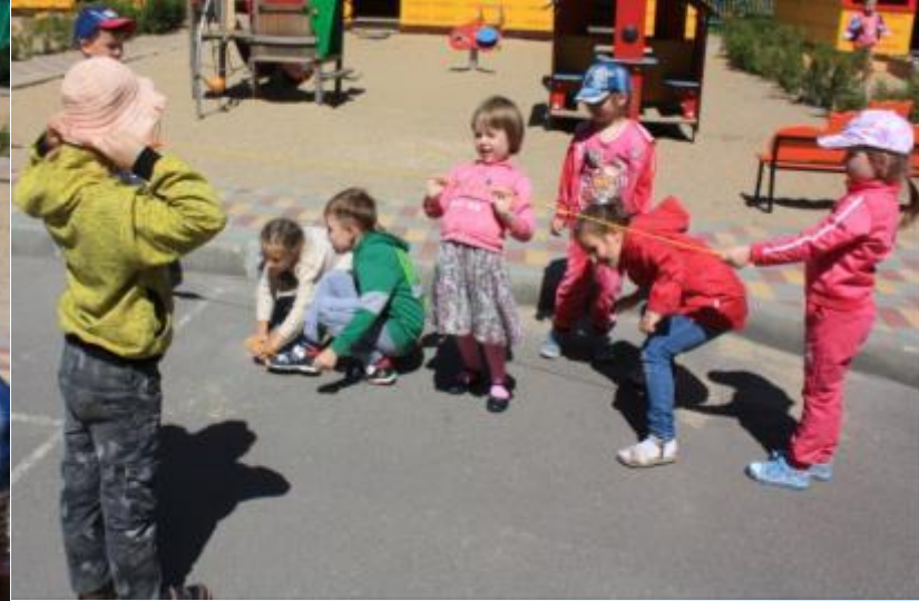
«Рыбки и невод»