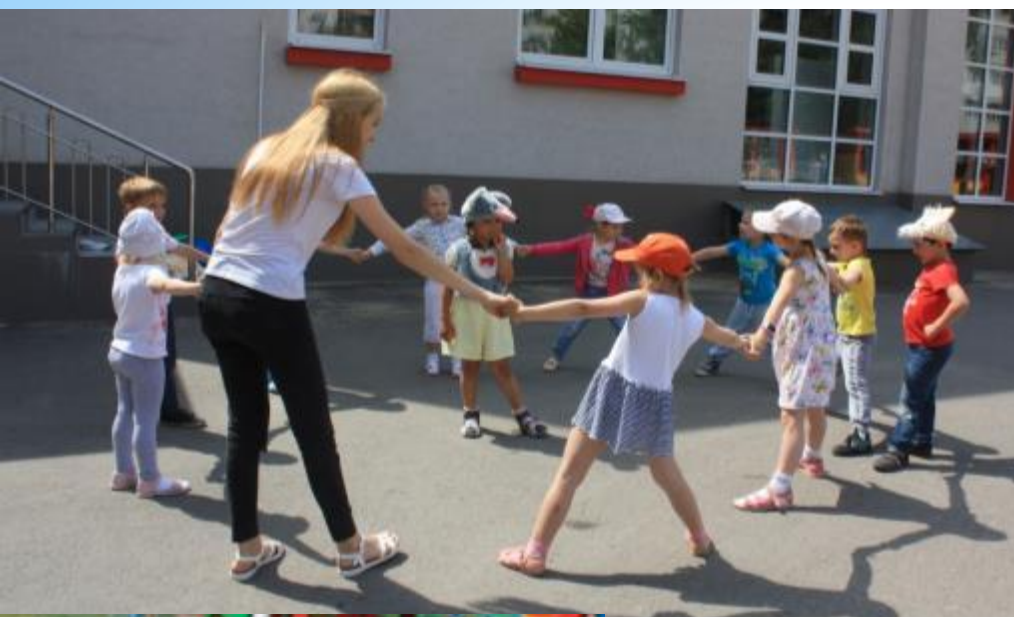
Подвижная игра «Кошки - мышки»