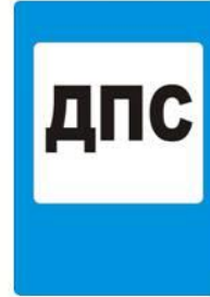
Пост дорожно – патрульной службы