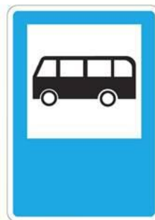
Место остановки автобусов