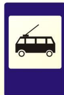
Место остановки троллейбусов