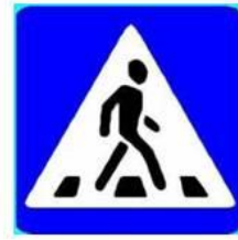
Пешеходный переход (место перехода через дорогу)