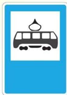
Место остановки трамвая