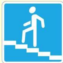
Подземный пешеходный переход (место перехода через дорогу)

- Информировуют о расположении населенных пунктов и других объектов