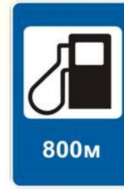
Авто – заправочная станция