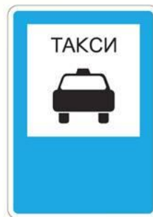
Место остановки такси