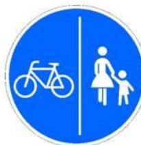
Дорожка для пешеходов и велосипедистов