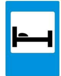
Гостиница или мотель