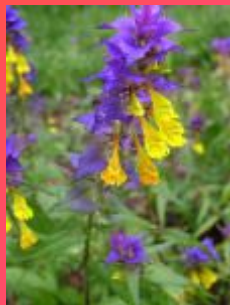
Иван да Марья