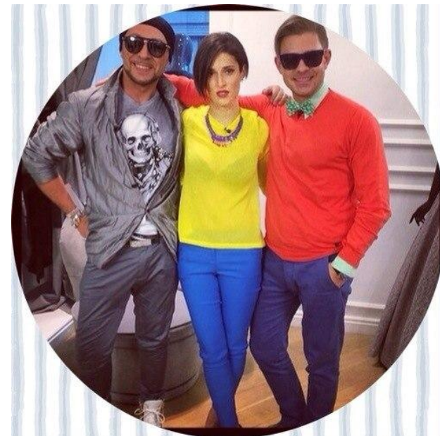
Митя Фомин – певец