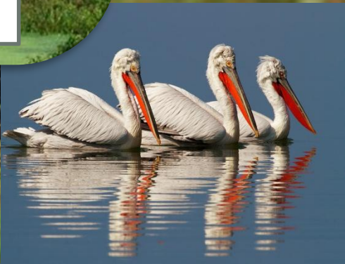
Природный образ Кеоладео