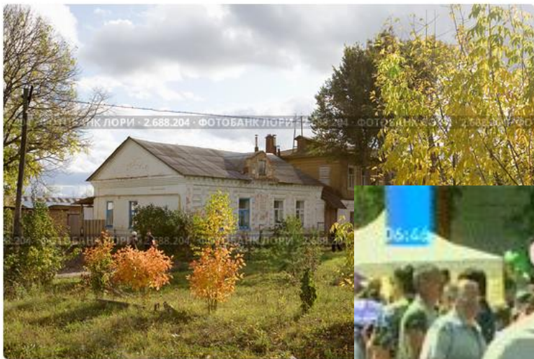
Село Крапивна в Тульской области, золотая осень