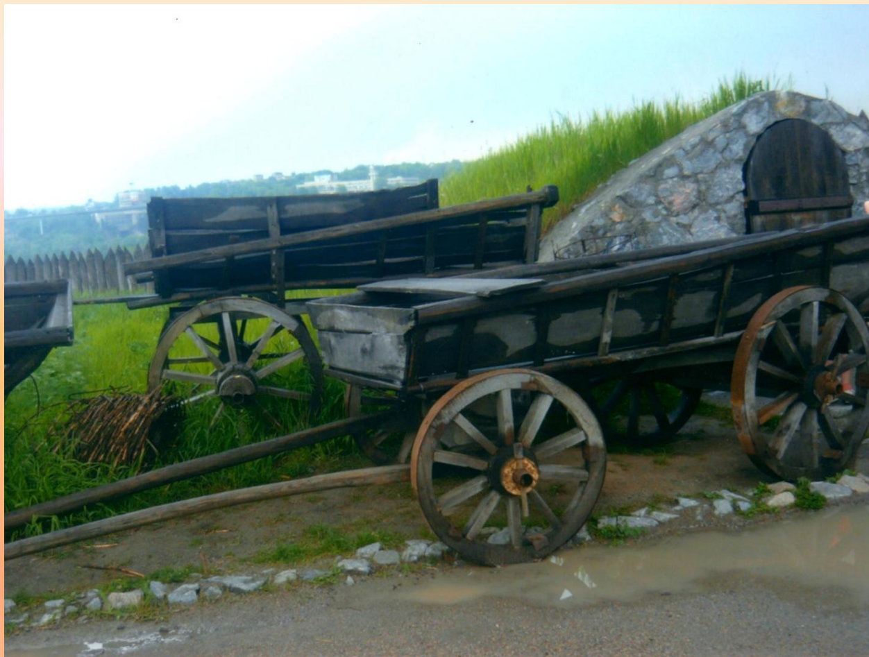
Зимівник звичайного козака