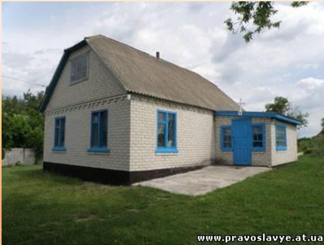
Свято-Покровський храм с. Зеленьки