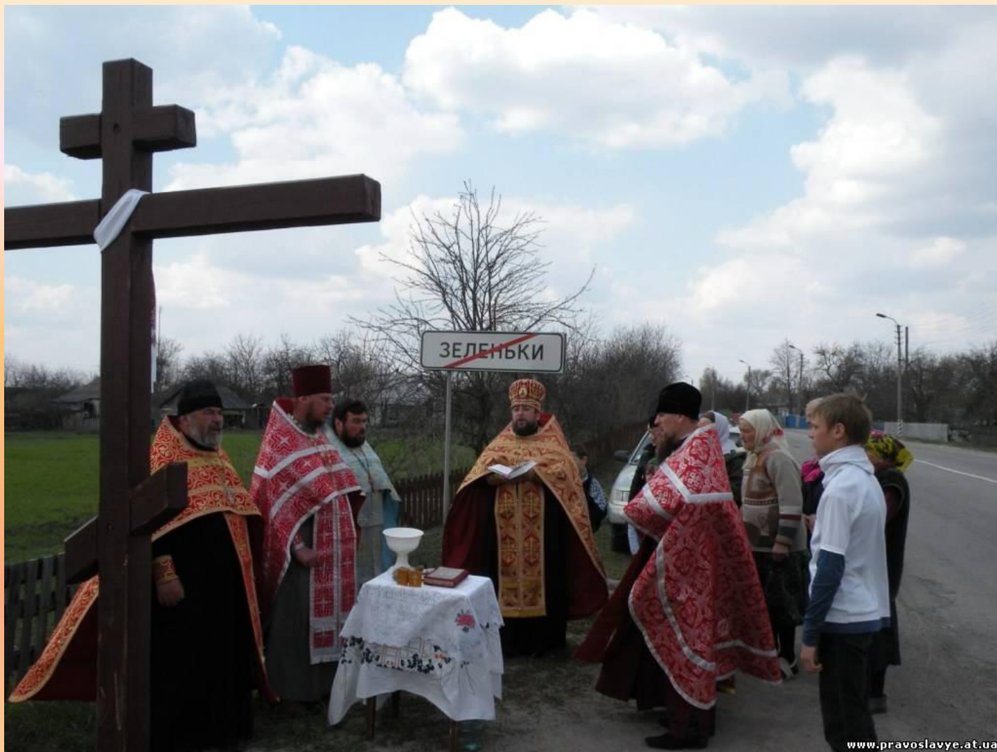
Освячення Хрестів з усіх сторін села Зеленьки