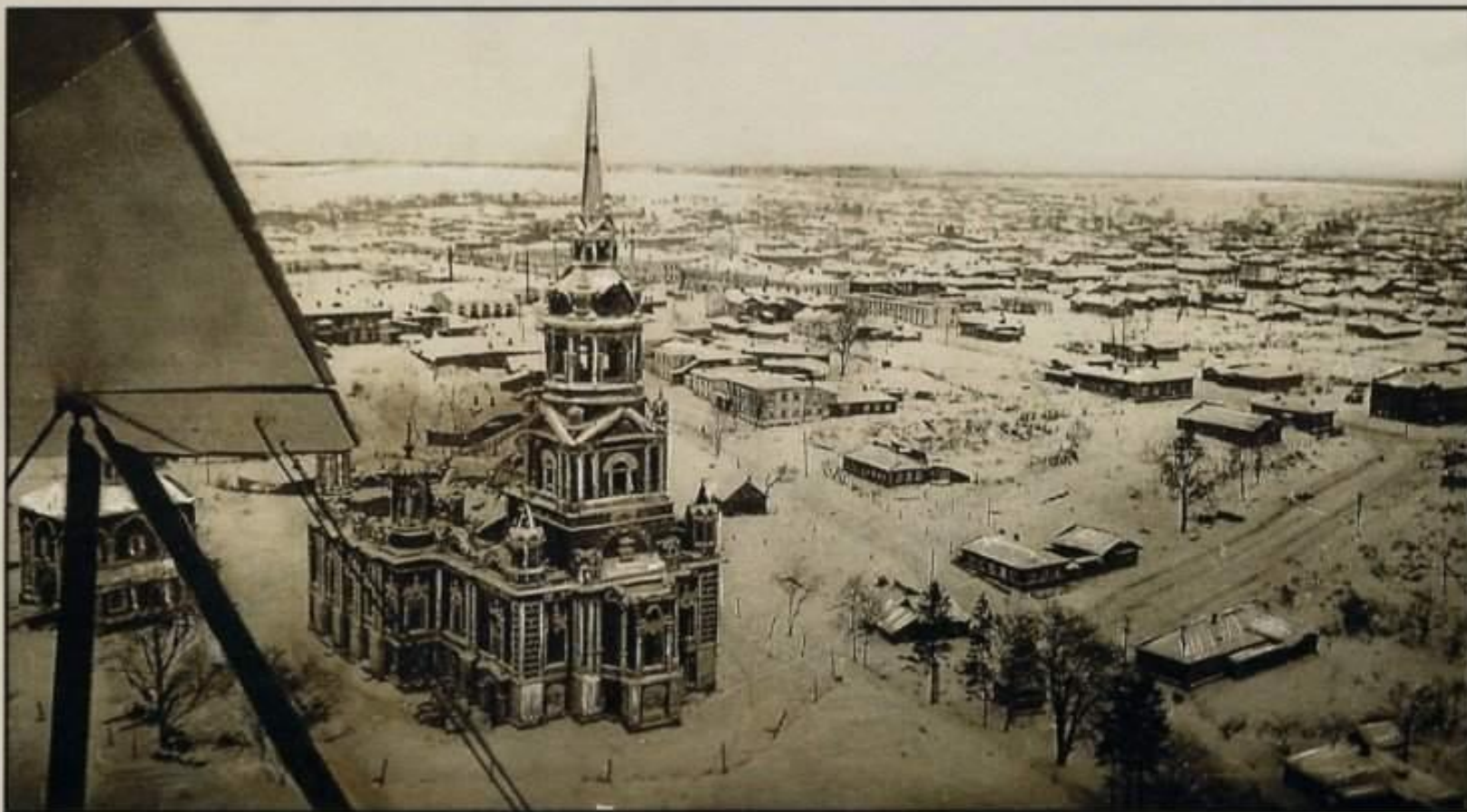
Можайск в день освобождения от фашистов. Аэроснимок военкора ТАСС Д. Чернова. Январь 1942 г.