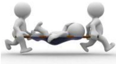
Ответственность за группу