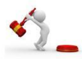
Право голоса в формировании учебного процесса