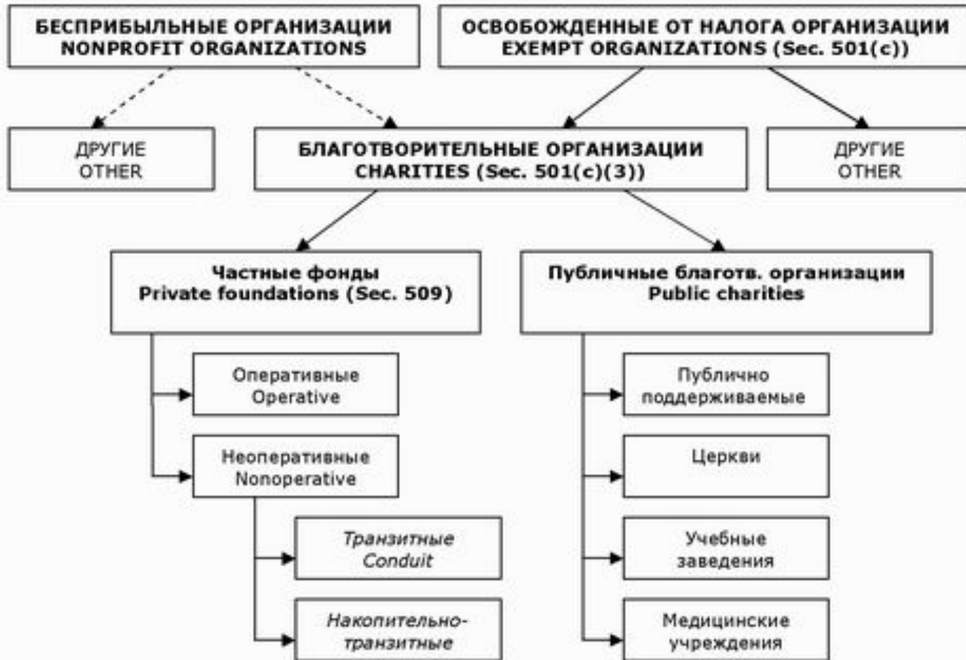
Благотворительные организации в США. Упрощенная схема