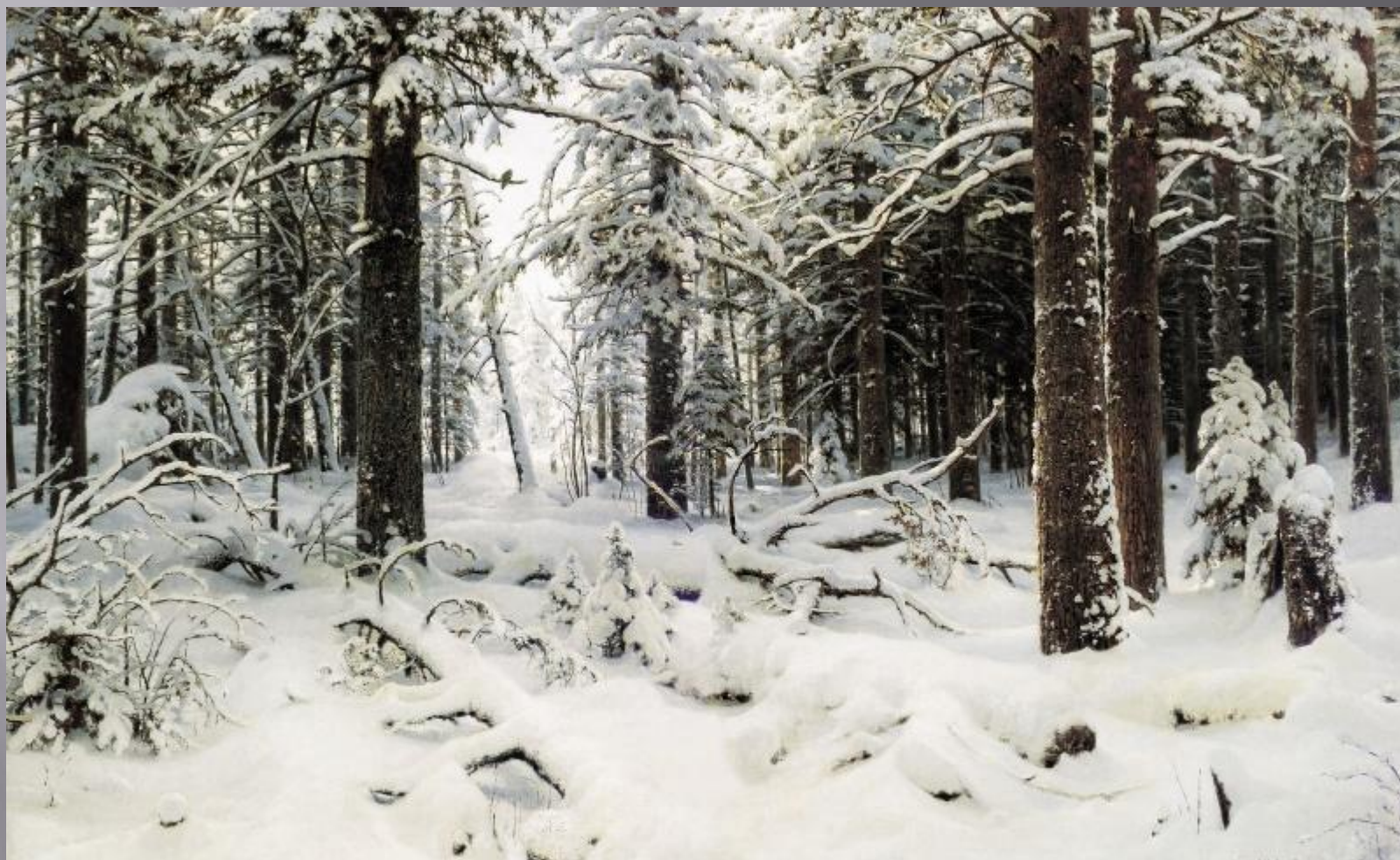
Иван Иванович Шишкин. «Зима».