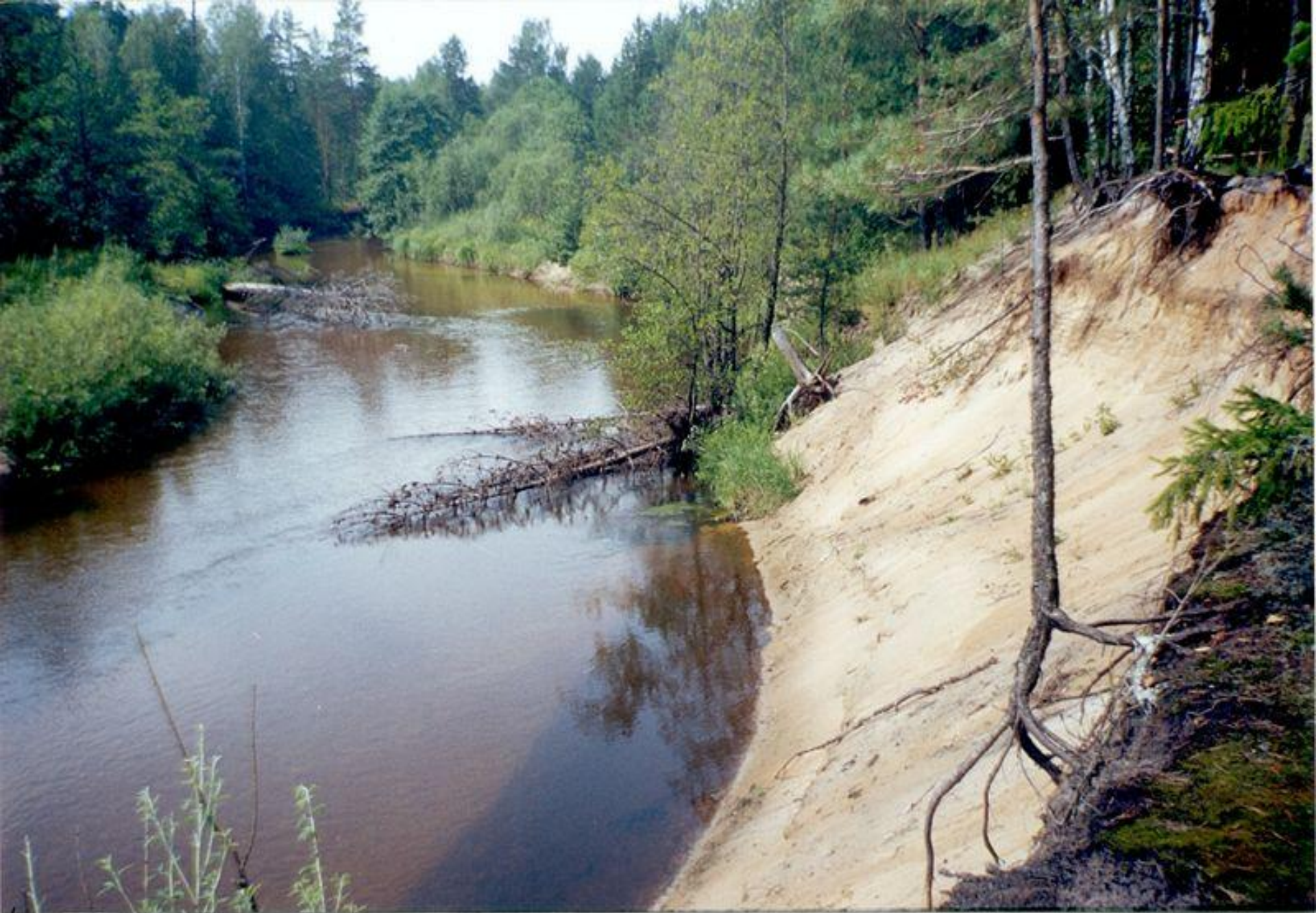
ГЕСка Юшу Г.