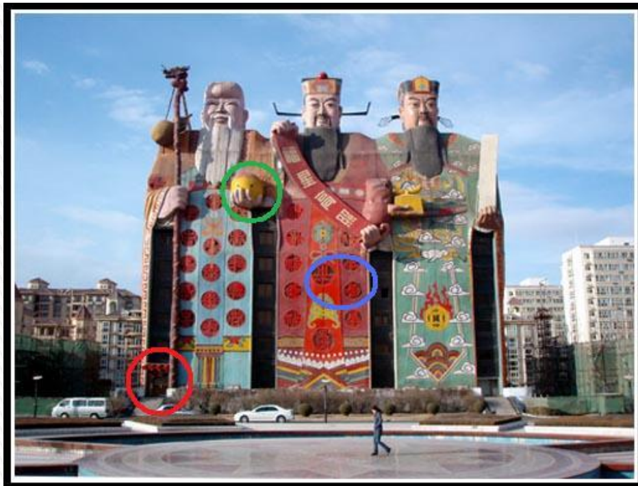
北京天子大酒店 北京林业大学深圳分院设计

Входы в отель располагаются справа и слева (на фото отмечено красным), окна номеров скрываются за узорами платьев (синий кружок), а овощ в руке левого богатыря содержит люксовский номер (зеленый кружок, там две оконные «дырки»).