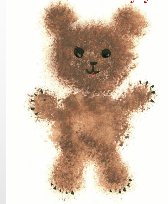
рисование жесткой полусухой кистью