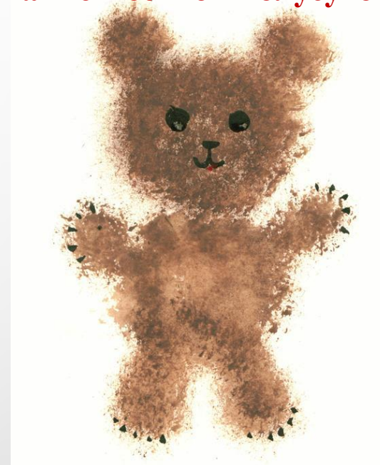
рисование жесткой полусухой кистью