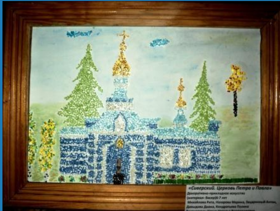
«Сиверский. Церковь Петра и Павла»