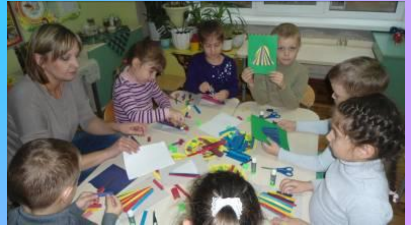
Техника «Айрис – фолдинг»