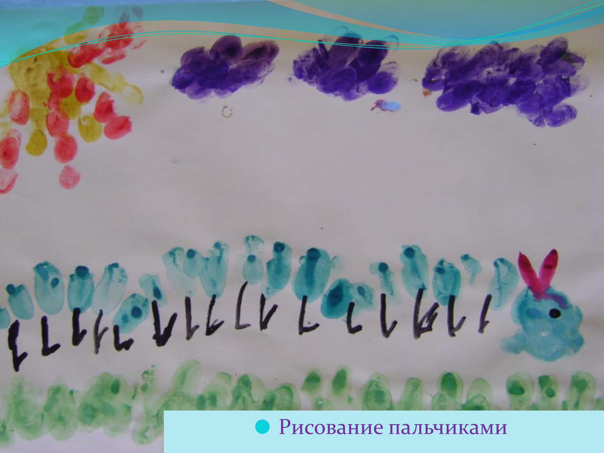
● Рисование пальчиками