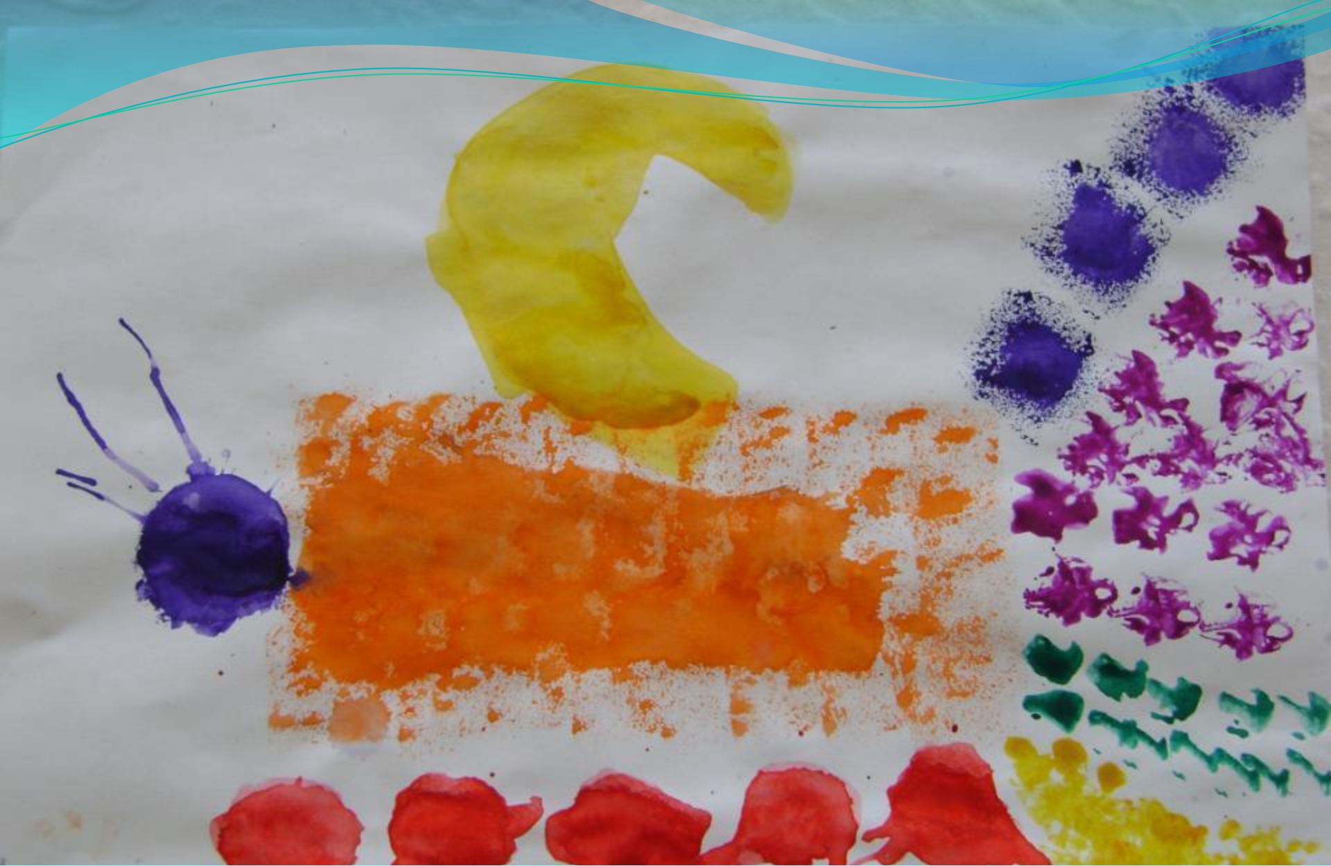
● Кляксография, оттиск поролоном, рисование тупым концом карандаша