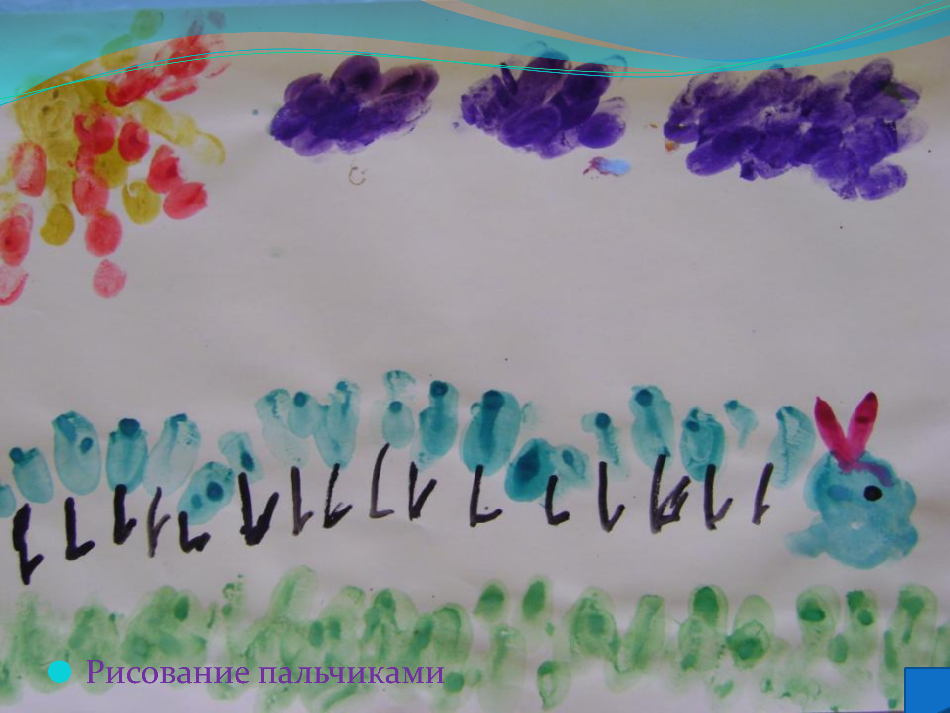
● Рисование пальчиками