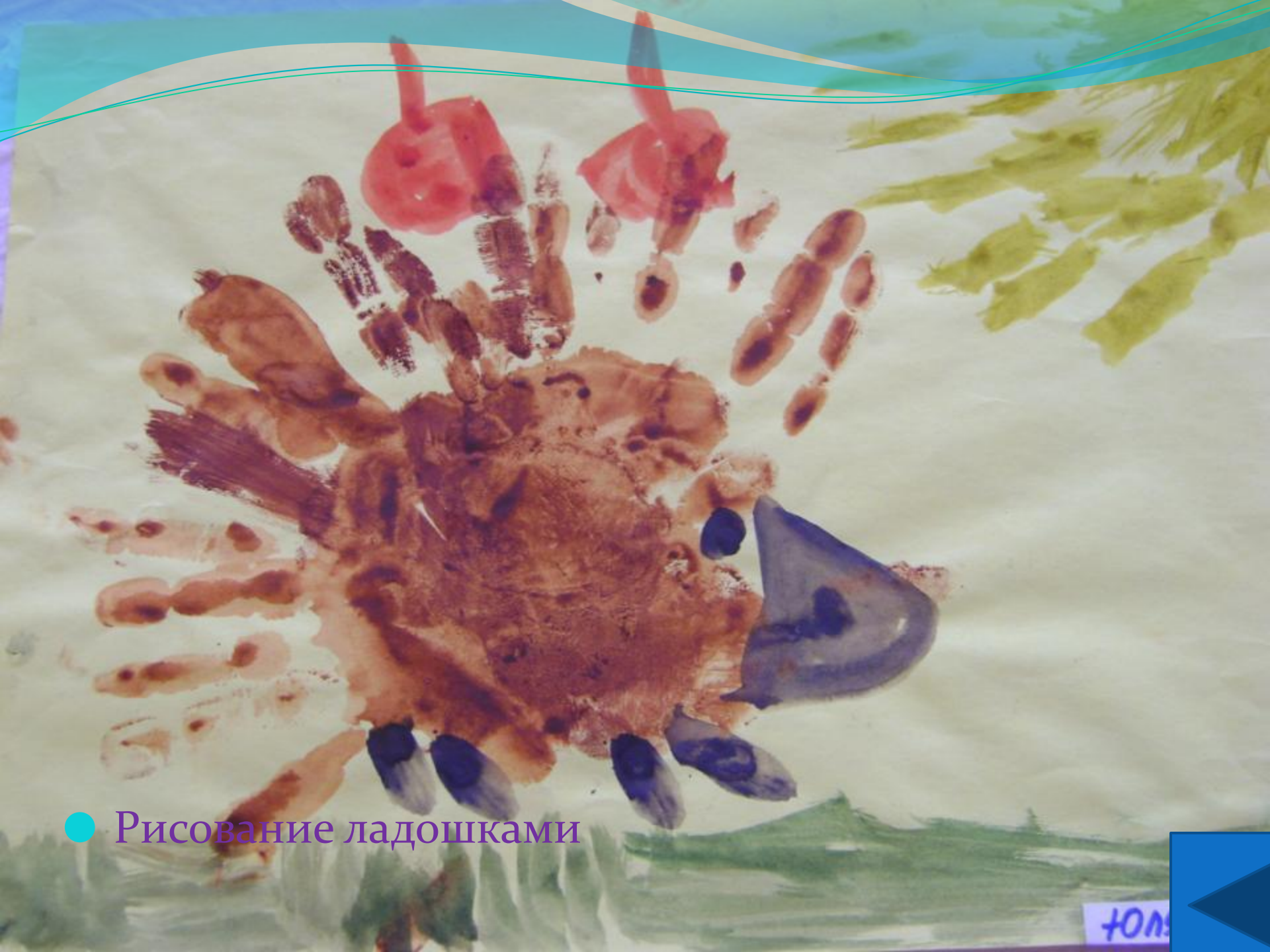
● Рисование ладошками