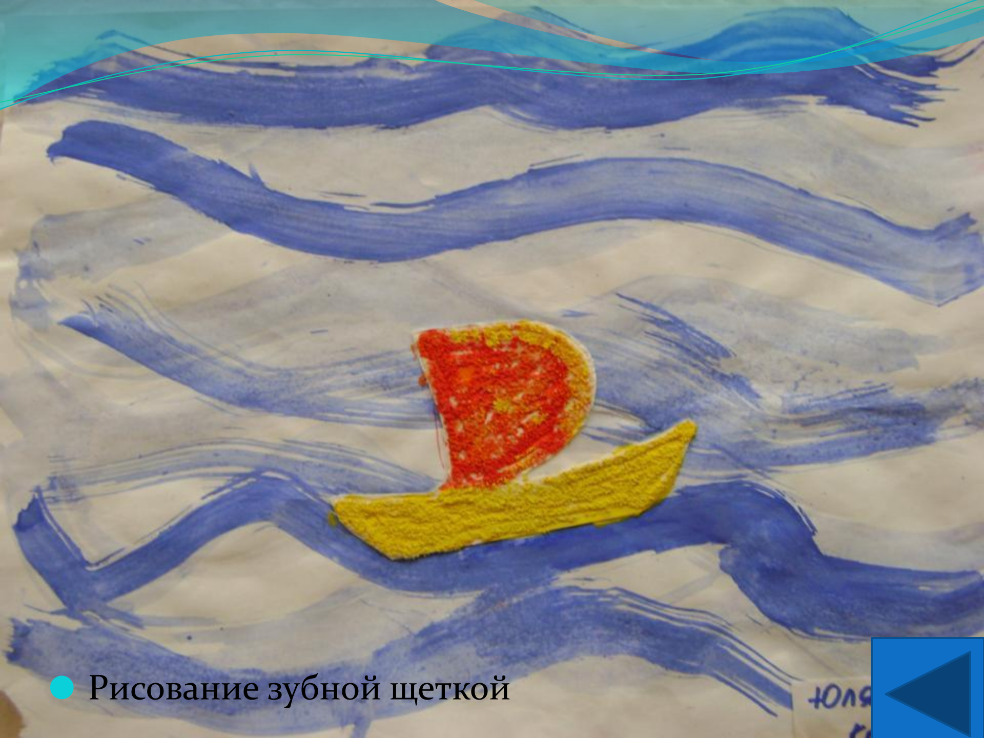
● Рисование зубной щеткой