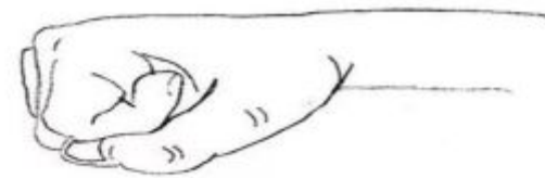
Ладонь, скатая в кулак