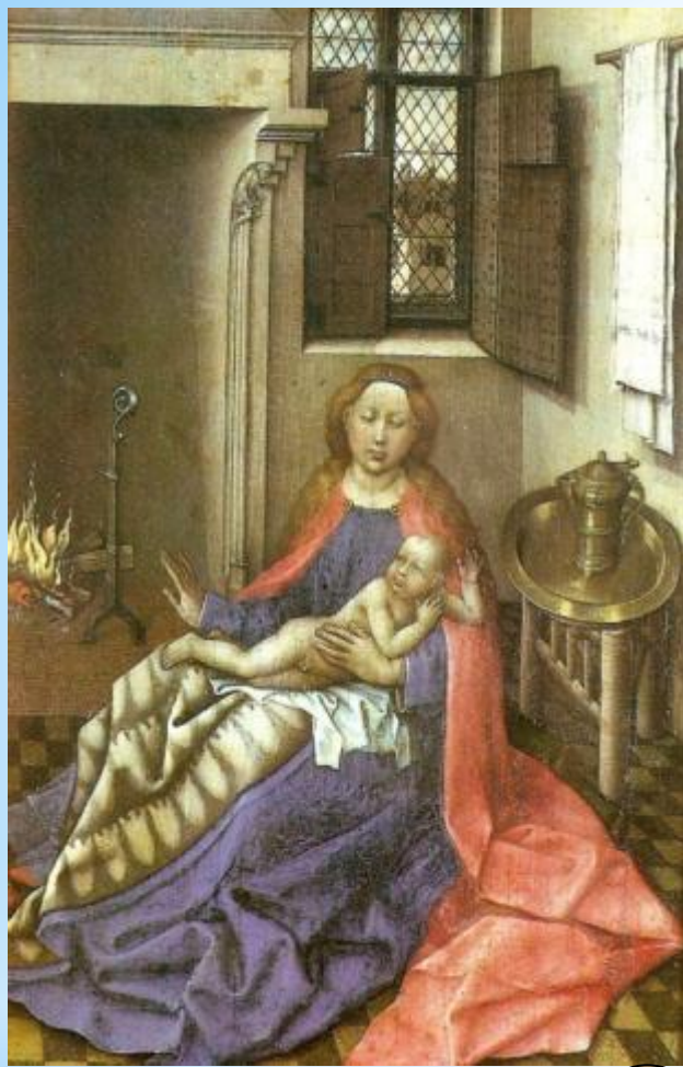
Мадонна с младенцем Робер Кампен