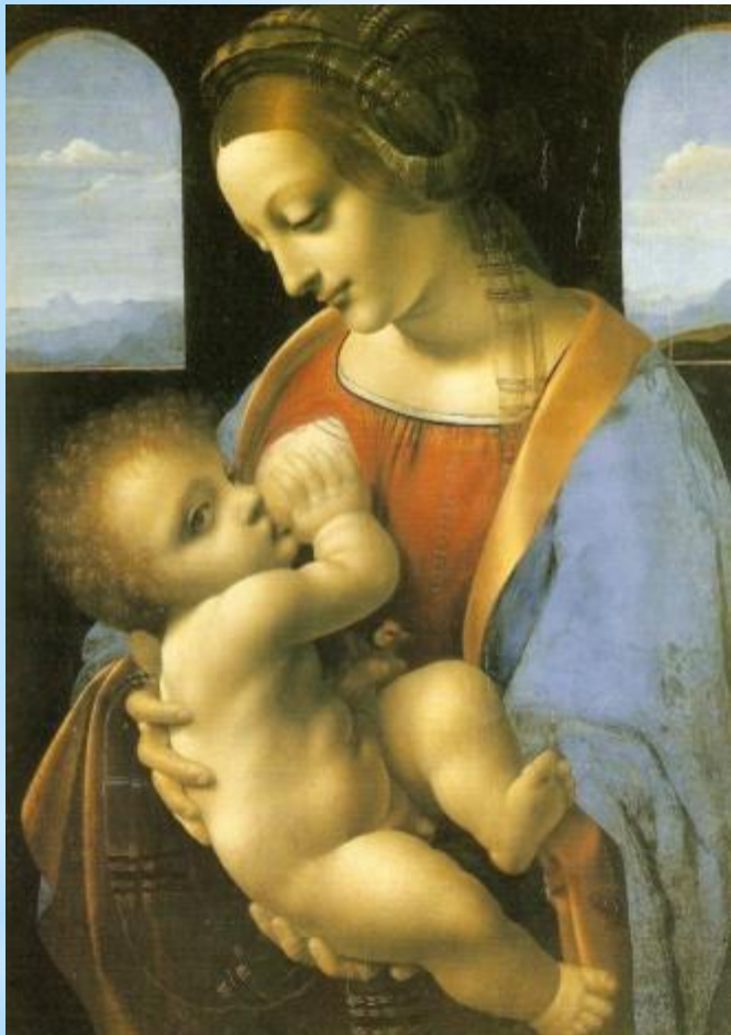
Мадонна с младенцем Леонардо да Винчи

В этот день, знаменательный самый, Ты прими благодарность мою. Мама, мама, милая мама, Я тебя всей душою люблю!