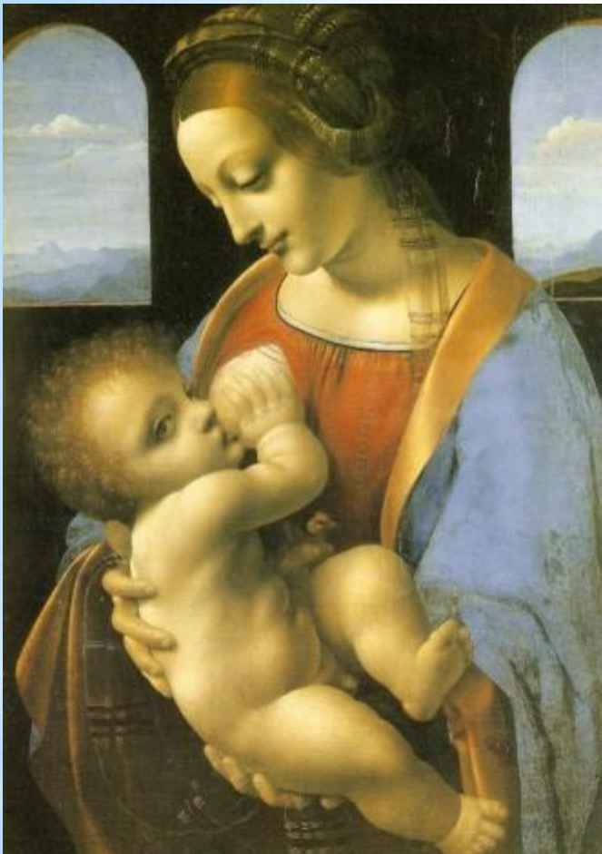
Мадонна с младенцем Леонардо да Винчи

Слов не хватит, не хватит и сил, Чтоб любовь всю Тебе передать.