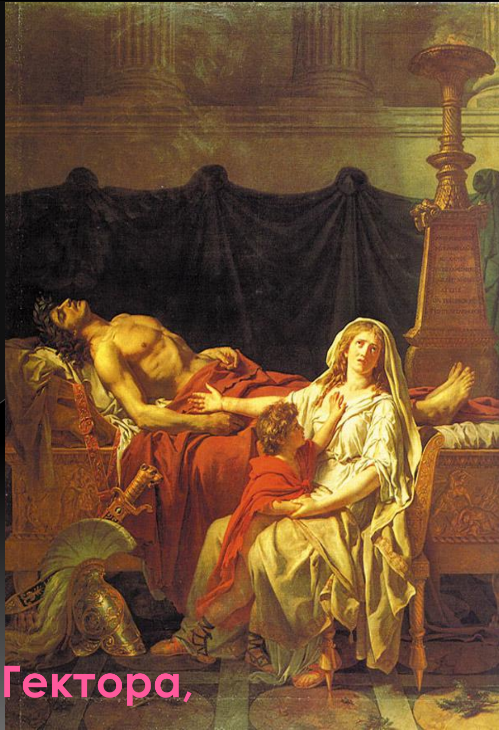
Андромаха у тела Гектора, 1782