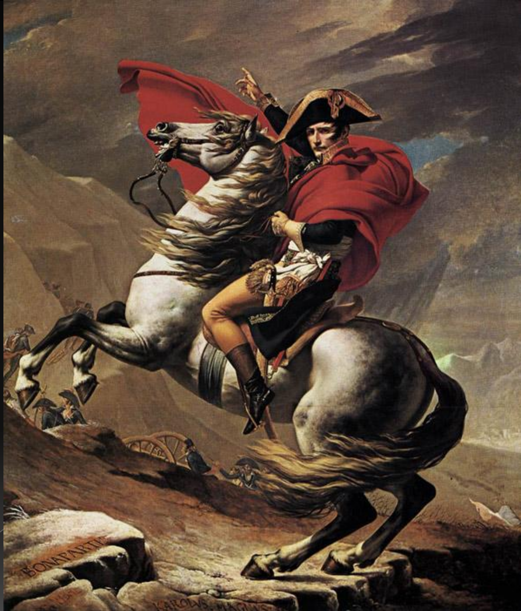
Наполеон на перевале Сен-Бернард