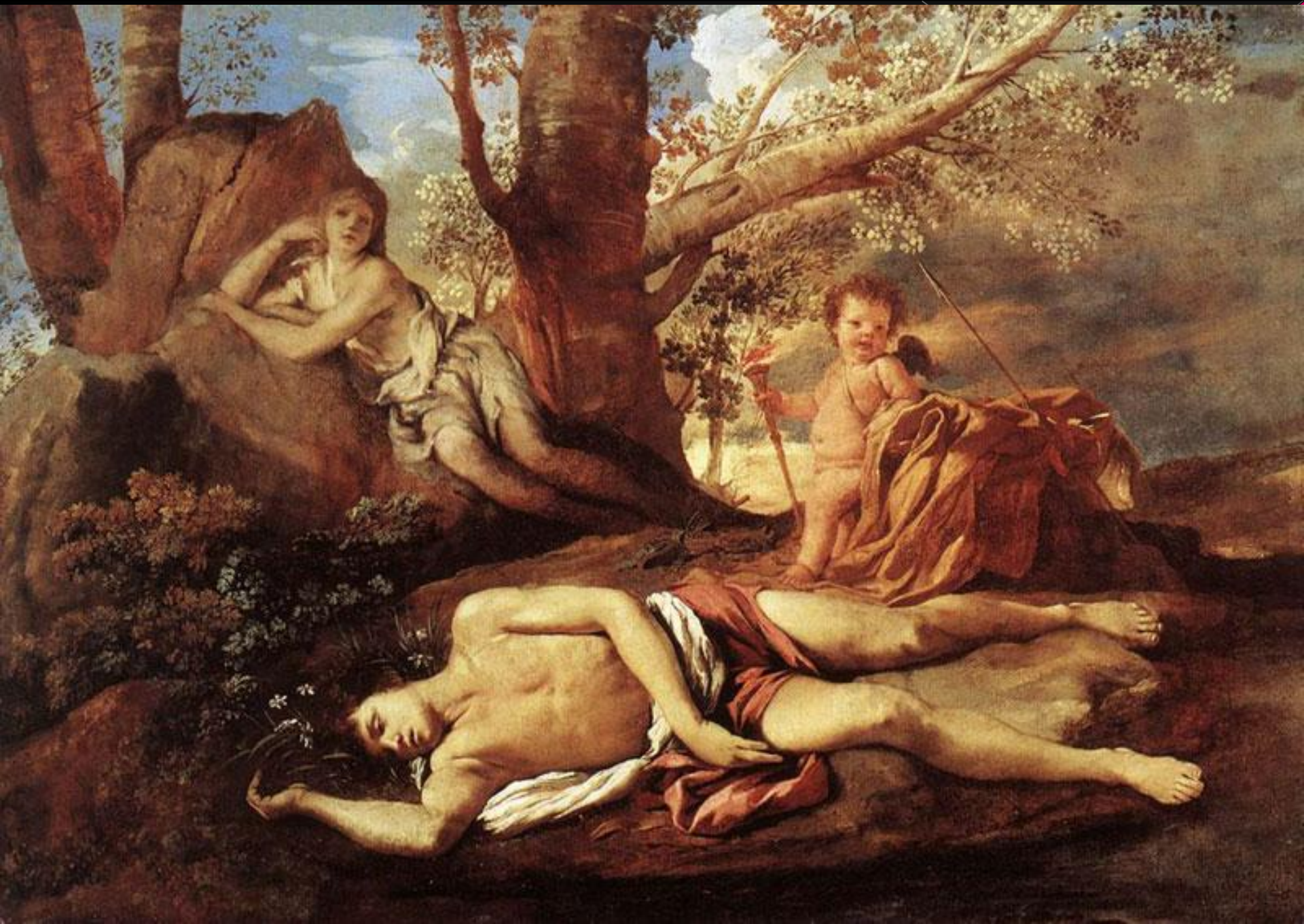
Эхо и Нарцисс