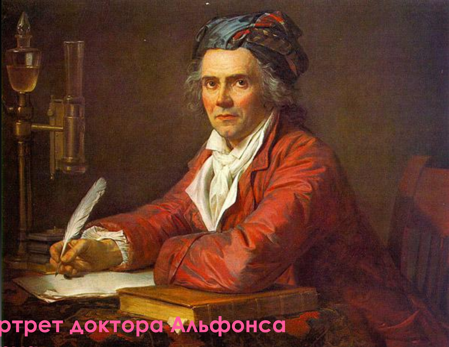
Портрет доктора Альфонса Леруа