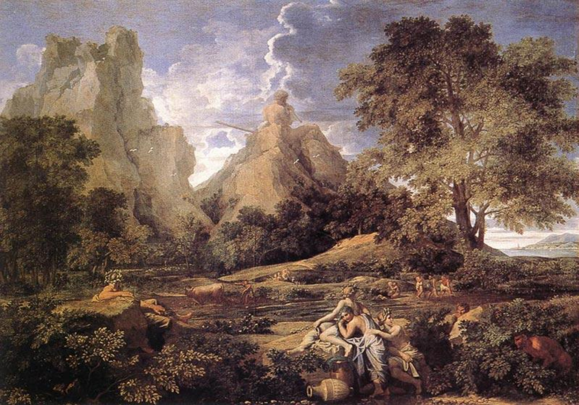
Пейзаж с полифемом