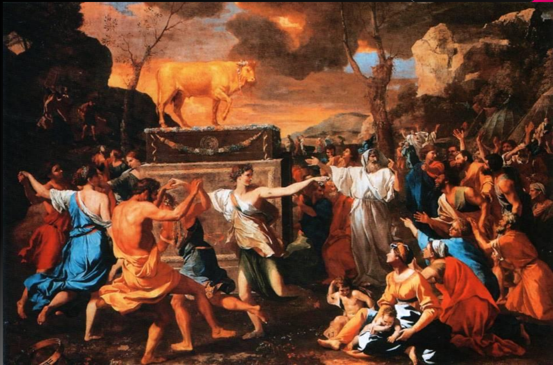
Поклонение золотому тельцу