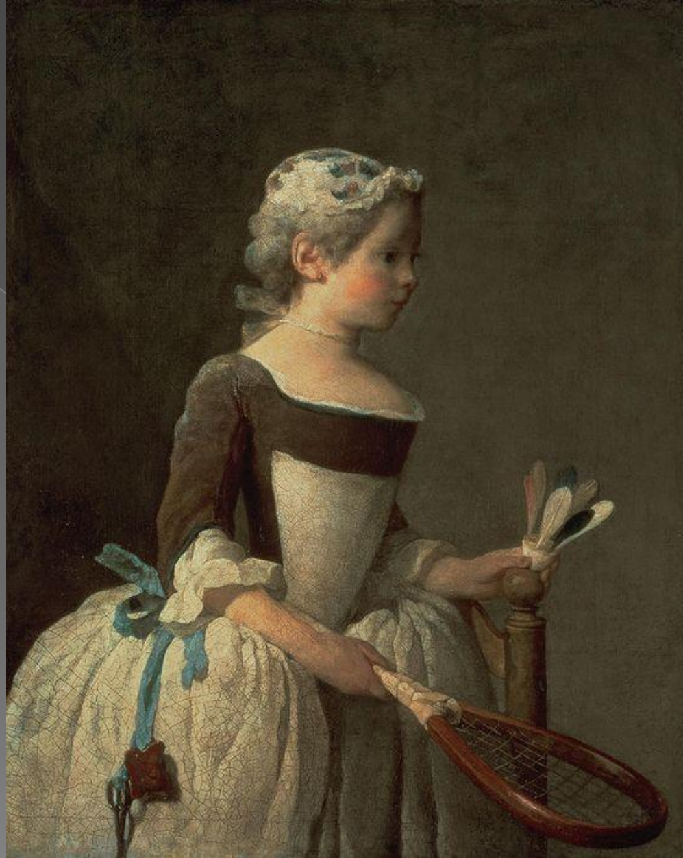
Девочка с ракеткой и волачиком