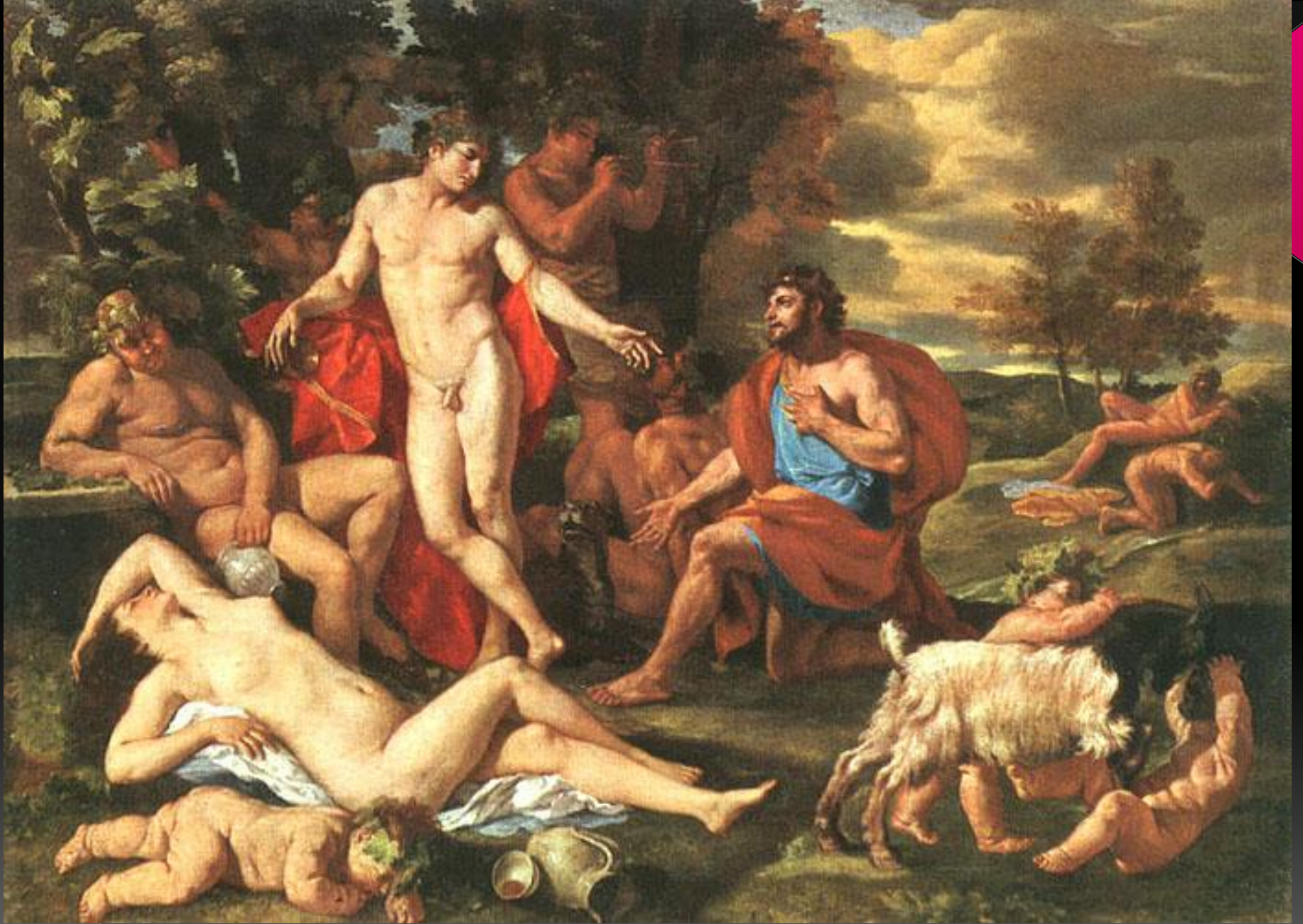
Мидас и Бахус