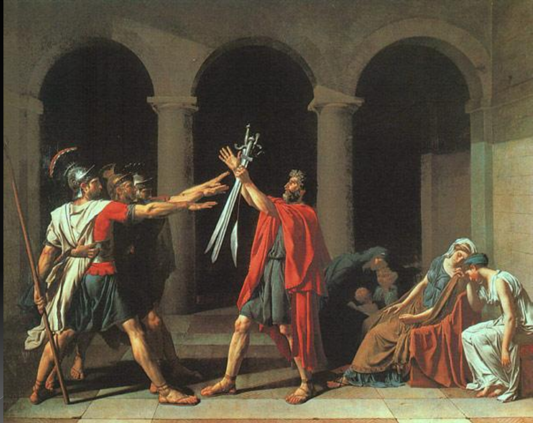
Клятва І орациев