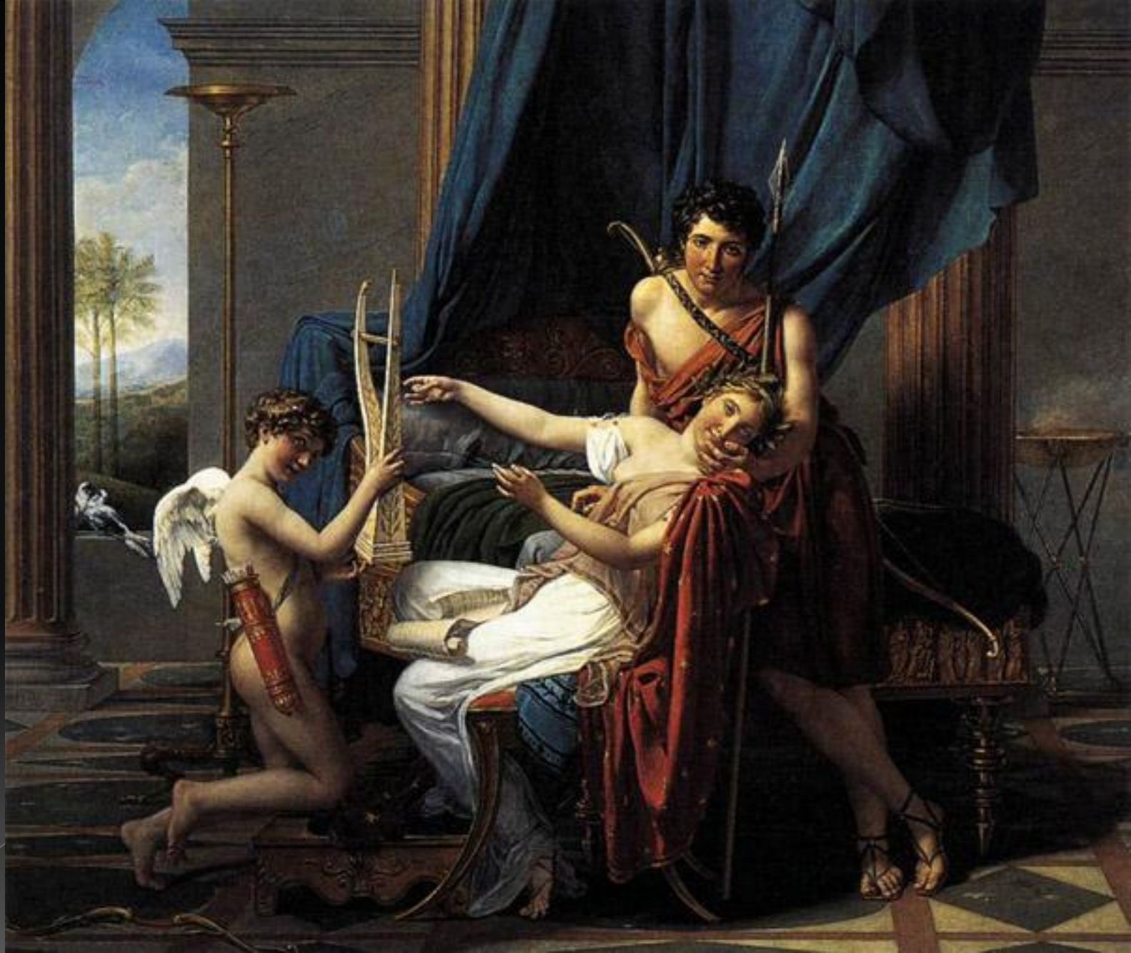
Сафо и Фаон