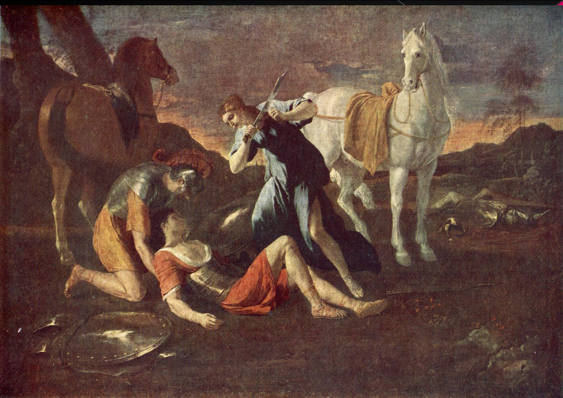
Танкред и Эльминия