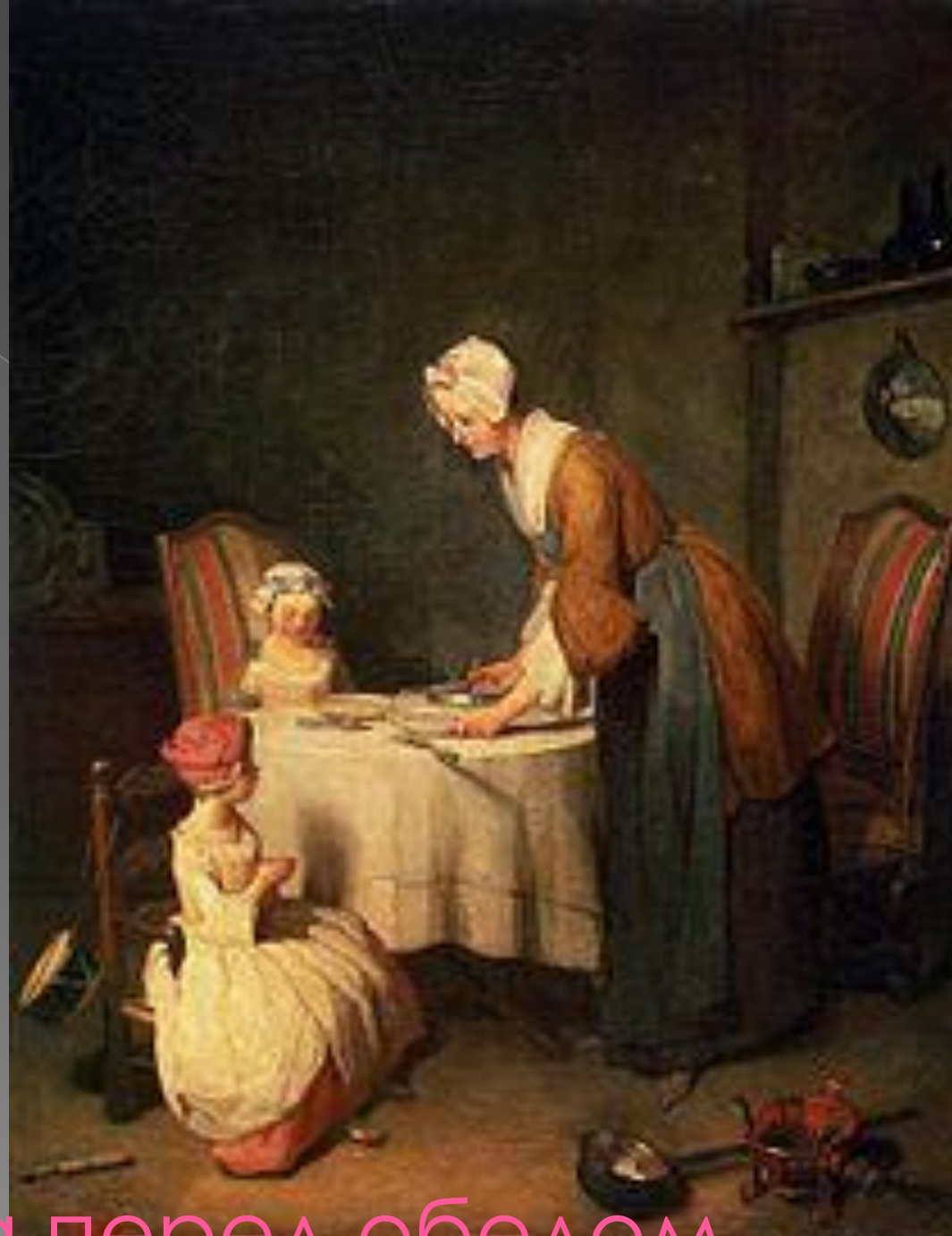
Молитва перед обедом