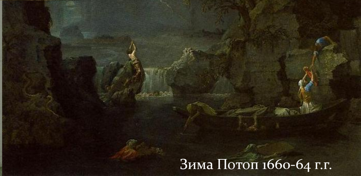
Зима Потоп 1660-64 г.г.