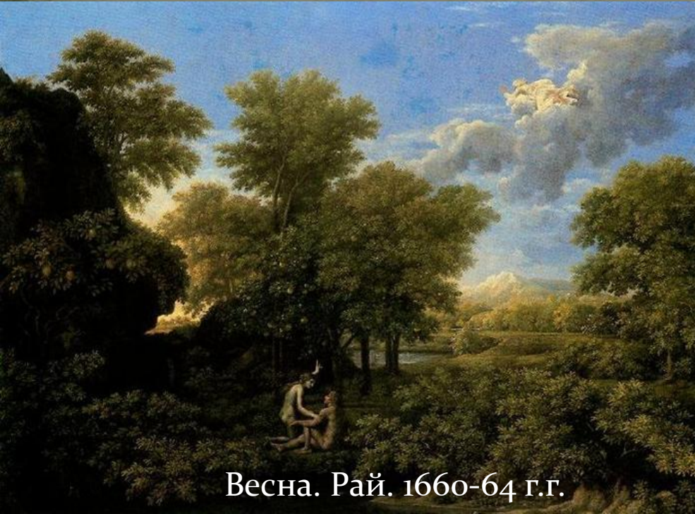
Весна. Рай. 1660-64 г.г.