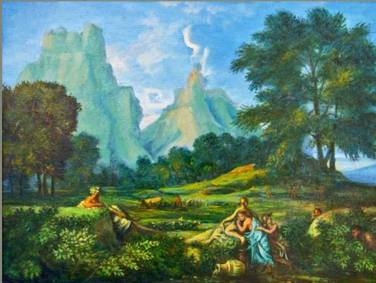
Пейзаж с Полифемом 1649