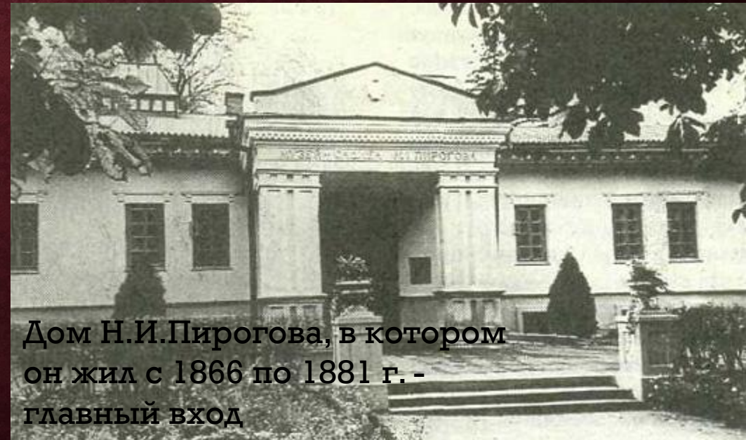
Дом Н.И.Пирогова, в котором он жил с 1866 по 1881 г. - главный вход