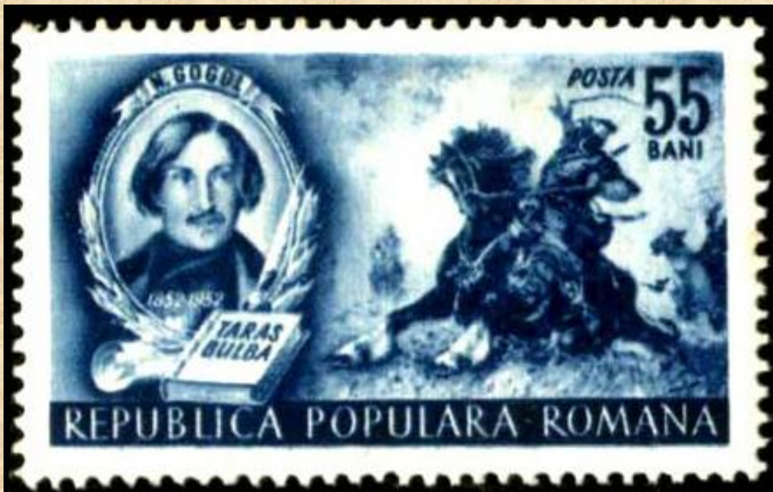
Почтовая марка Румынии, посвящённая 100-летию со дня смерти Н. В. Гоголя («Тарас Бульба», 1952)