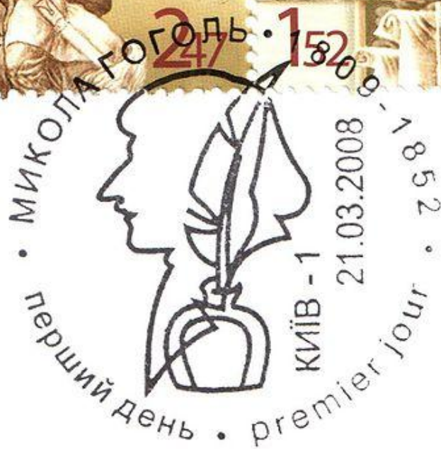
Украина (2008): почтовые марки и гашение к 200-летию со дня рождения Н. В. Гоголя. На левой марке — «Тарас Бульба».