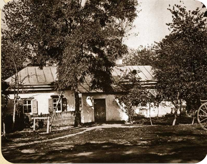
Дом, где родился Н.В. Гоголь.