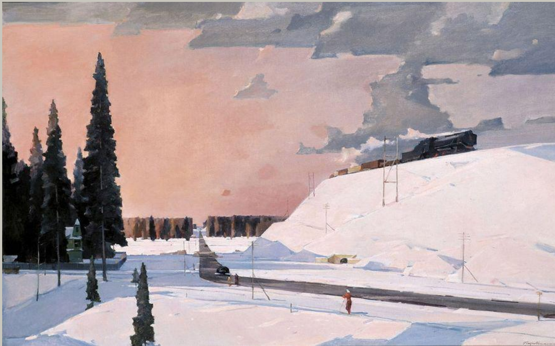
«Февраль. Подмосковье». 1957