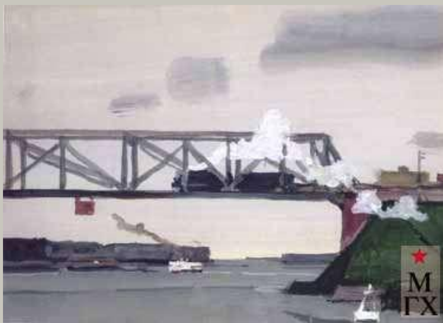
Мост на канале. 1957