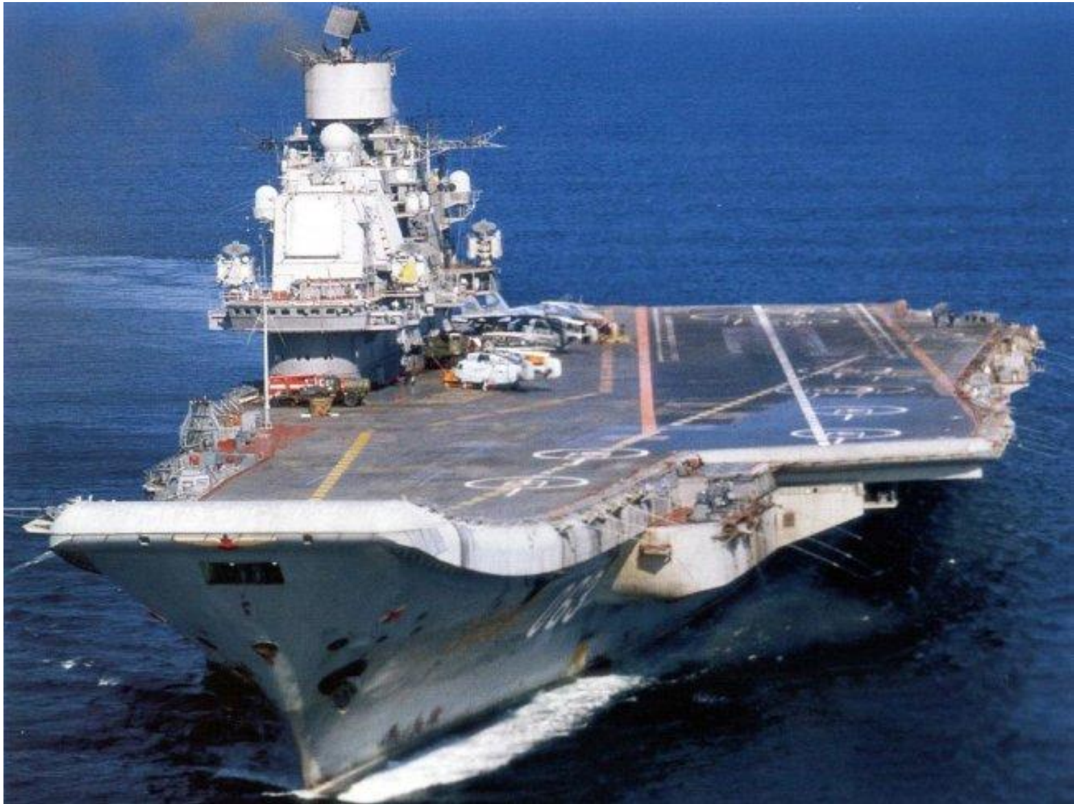
Тяжелый авианесущий крейсер «Адмирал Кузнецов»