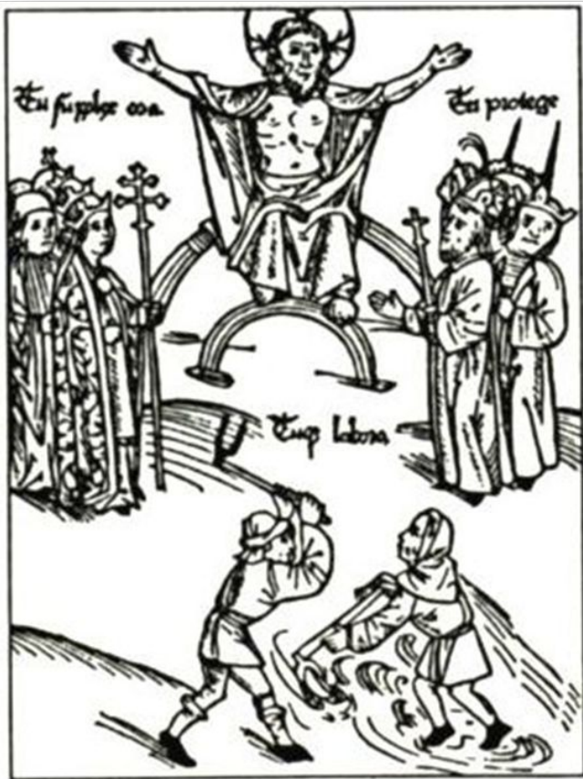
Три сословия (надписи означают: «Ты молиси!», «Ты защищай!», «Ты работай!») Гравюра (XV в.)