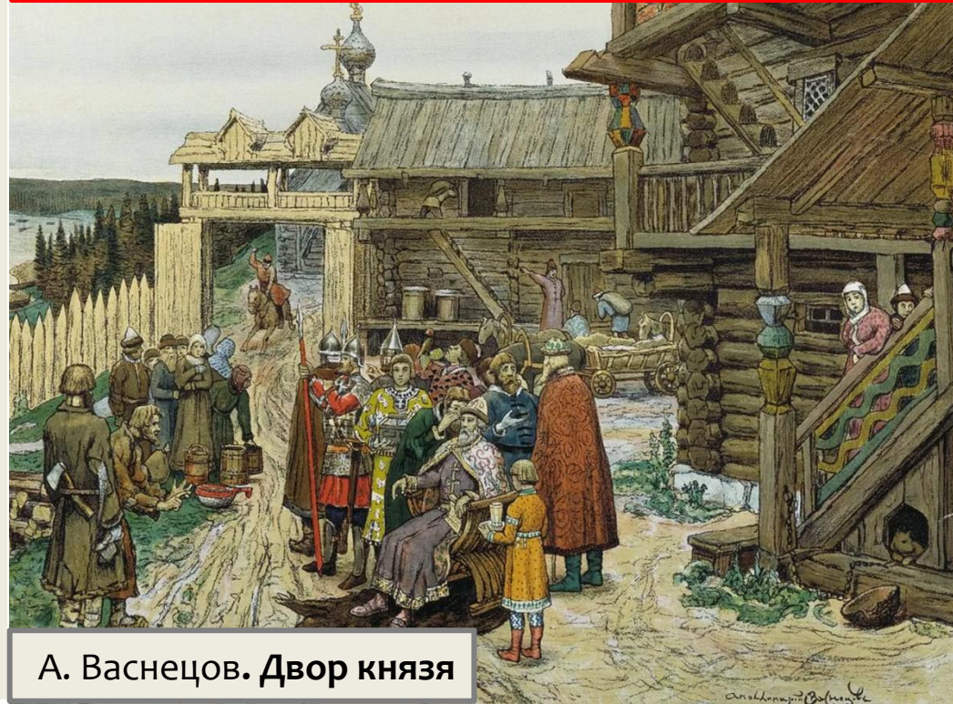
А. Васнецов. Двор князя

Вспомните, какие повинности в пользу феодала несли зависимые крестьяне в Западной Европе?