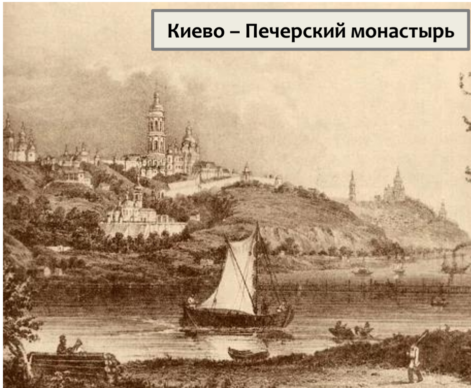
Киево – Печерский монастырь

Вспомните имя самого известного летописца - монаха Киево – Печёрского монастыря?