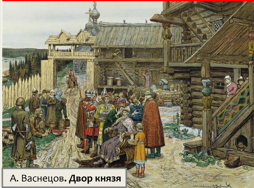
А. Васнецов. Двор князя

Вспомните, какие повинности в пользу феодала несли зависимые крестьяне в Западной Европе?