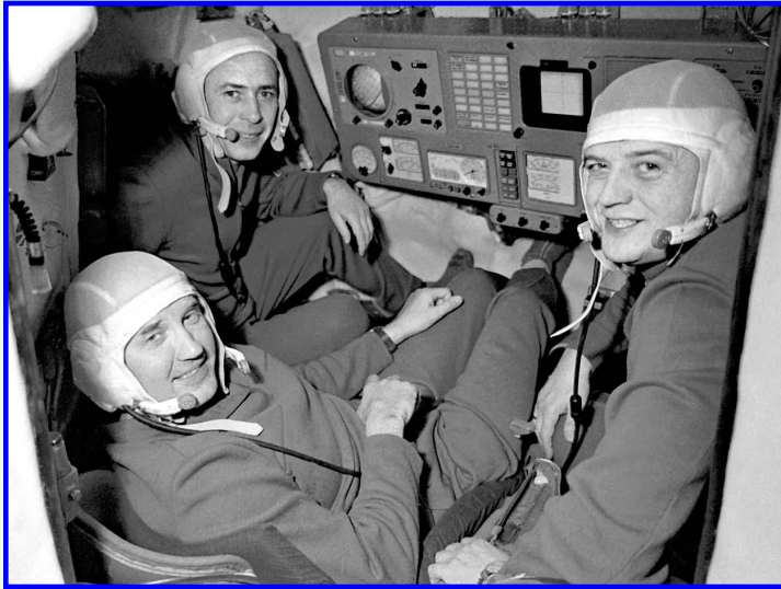
В.Комаров, Г.Добровольский, В.Пацаев – экипаж «Союза-11»