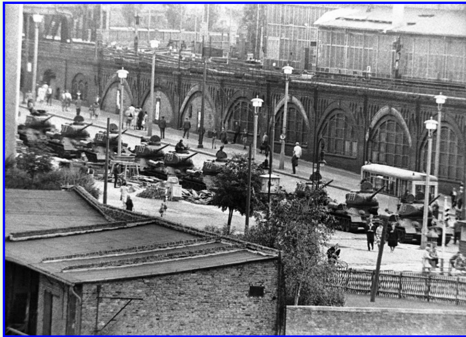
Советские танки на границе с Западным Берлином

В апреле 1961 г. Хрущев потребовал изменить статус Западного Берлина, со всех сторон окруженного ГДР. Он использовался западными разведками и через него из ГДР на Запад бежали многие специалисты. Отказ Кеннеди привел к противостоянию – советские и американские войска в Западном Берлине были приведены в состояние полной боевой готовности.