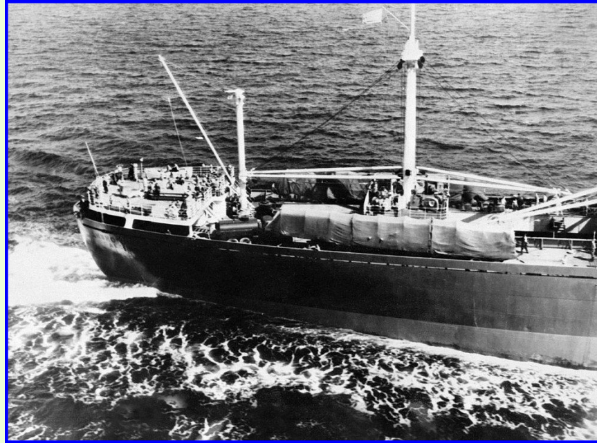
Советские транспортный корабль с ракетами на борту

В начале 60-х гг. СССР был со всех сторон окружен военными базами НАТО. В 1962 г. Н.Хрущев принял решение разместить ядерные ракеты средней дальности на Кубе.