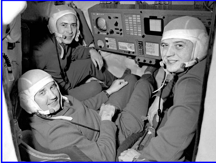
В.Комаров, Г.Добровольский, В.Пацаев – экипаж «Союза-11»