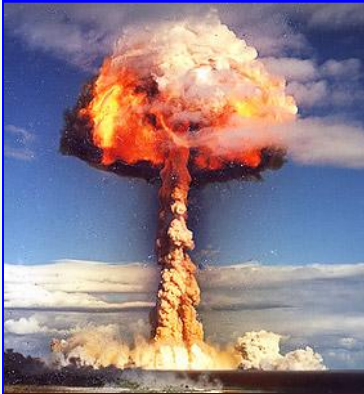
Взрыв атомной бомбы

Карибский кризис многому научил руководителей СССР и США. «Холодная война» пошла на спад.