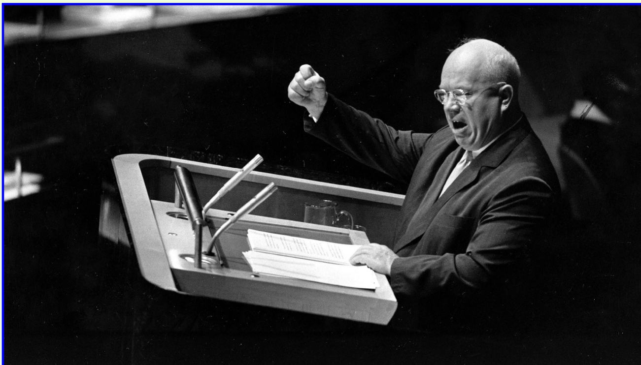
Руководитель СССР Н. Хрущев на трибуне ООН

1 мая 1960 г. над советской территорией ракетой был сбит американский самолет-шпион У-2.