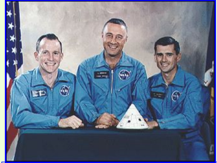
В.Гриссом, Э.Уайт, Р.Чаффи – экипаж «Аполлона-1»

Освоение космоса было рискованным и опасным делом. Часто в погоне за быстрым результатом пренебрегали техникой безопасности.