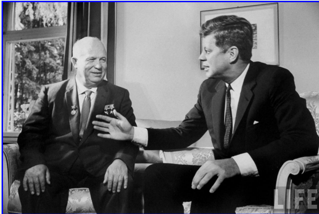
Хрущев и Кеннеди

Мир оказался на грани третьей мировой войны. Стратегические силы в СССР и в США были приведены в состояние полной боевой готовности. Но Хрущев и Кеннеди смогли договориться: СССР выводил ракеты с Кубы, а США отказывались от вмешательства в дела Кубы и обязались вывести свои ракеты с территории Турции.