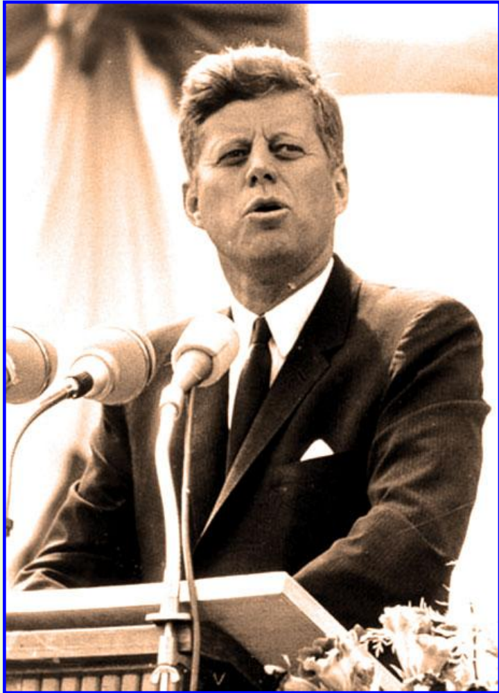
Президент США Дж. Кеннеди

В 1960 г. президентом США стал Дж.Кеннеди. Он выдвинул тезис об отставании США от СССР в технической и военной областях. Кеннеди выдвинул лозунг «Новых рубежей». США и их союзники должны были выйти на новые рубежи в техническом и военном отношении.