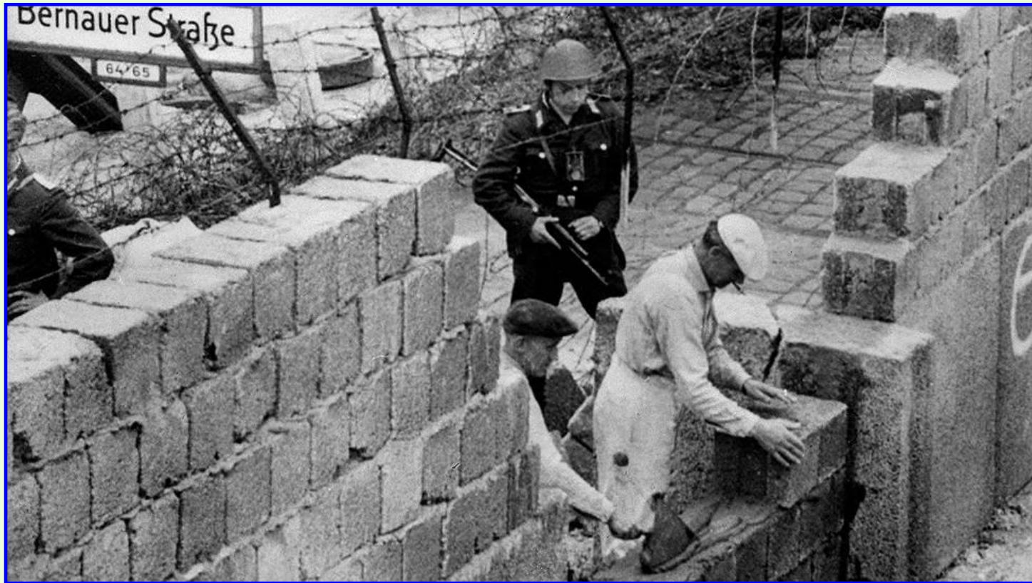
Строительство Берлинской стены

Хрущев не пошел на военное столкновение, но в августе 1961 г. власти ГДР окружили Западный Берлин бетонной стеной. Эта стена стала символом раздела Европы и Германии, символом «холодной войны».