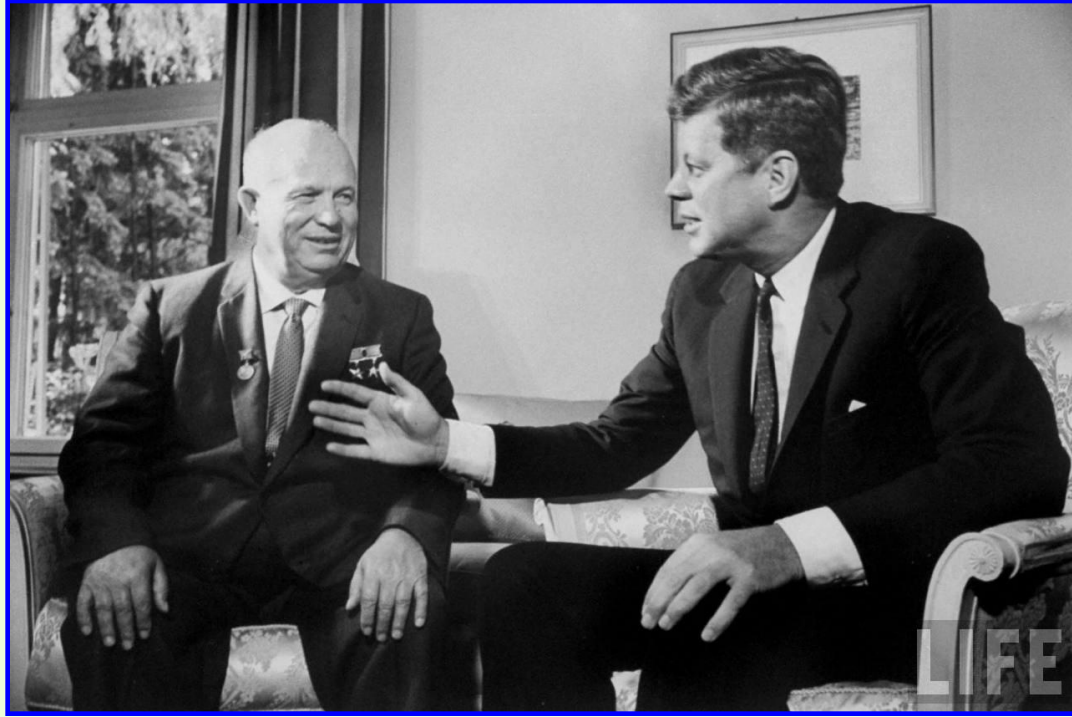
Хрущев и Кеннеди

Мир оказался на грани третьей мировой войны. Стратегические силы в СССР и в США были приведены в состояние полной боевой готовности. Но Хрущев и Кеннеди смогли договориться: СССР выводил ракеты с Кубы, а США отказывались от вмешательства в дела Кубы и обязались вывести свои ракеты с территории Турции.