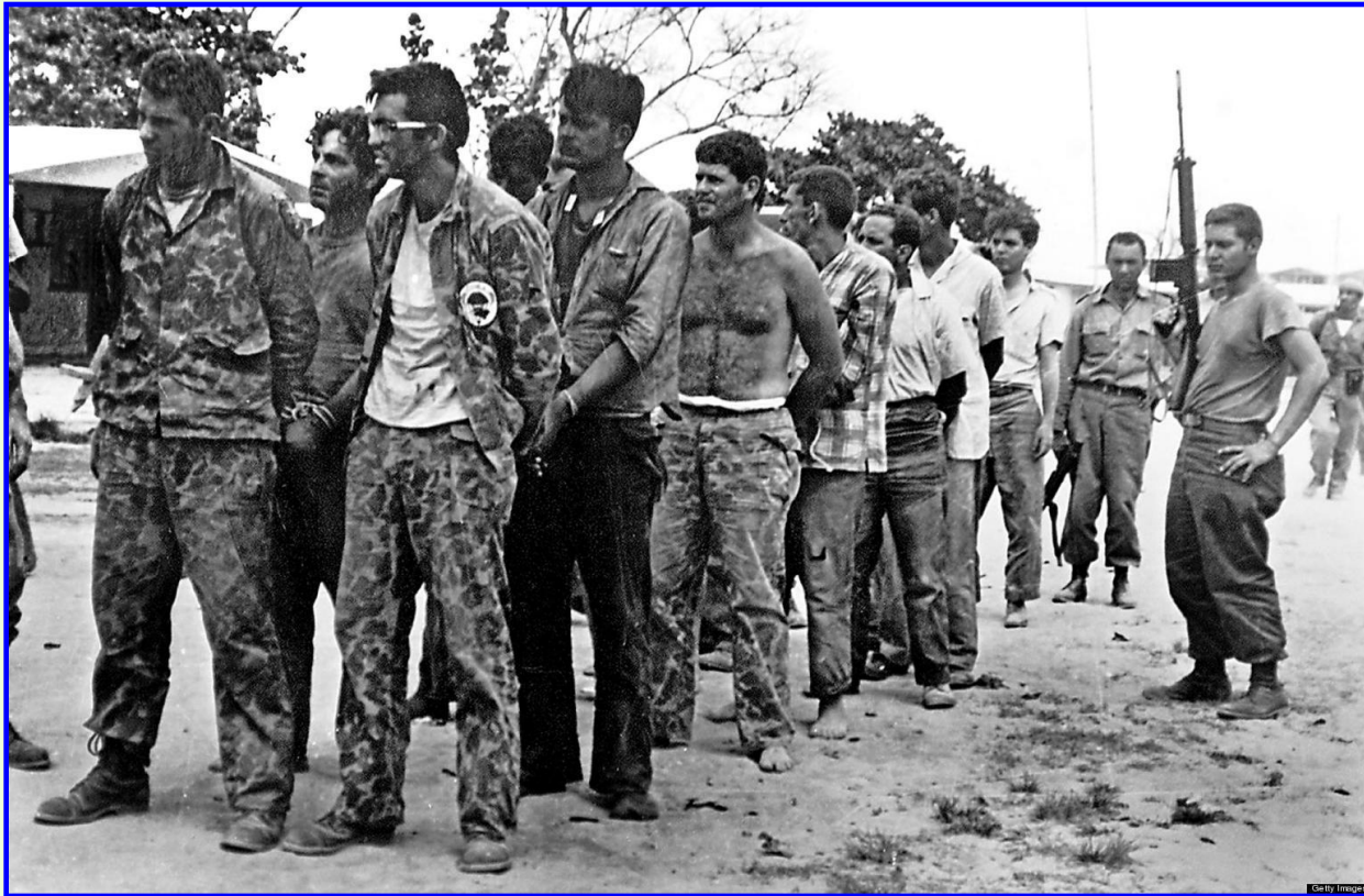
Пленные кубинские контрреволюционеры в заливе Свиней

В апреле 1961 г. ЦРУ по поручению президента Кеннеди попыталось свергнуть установленный на Кубе коммунистический режим Фиделя Кастро. Высадившиеся в заливе Свиней противники режима Кастро были разгромлены.