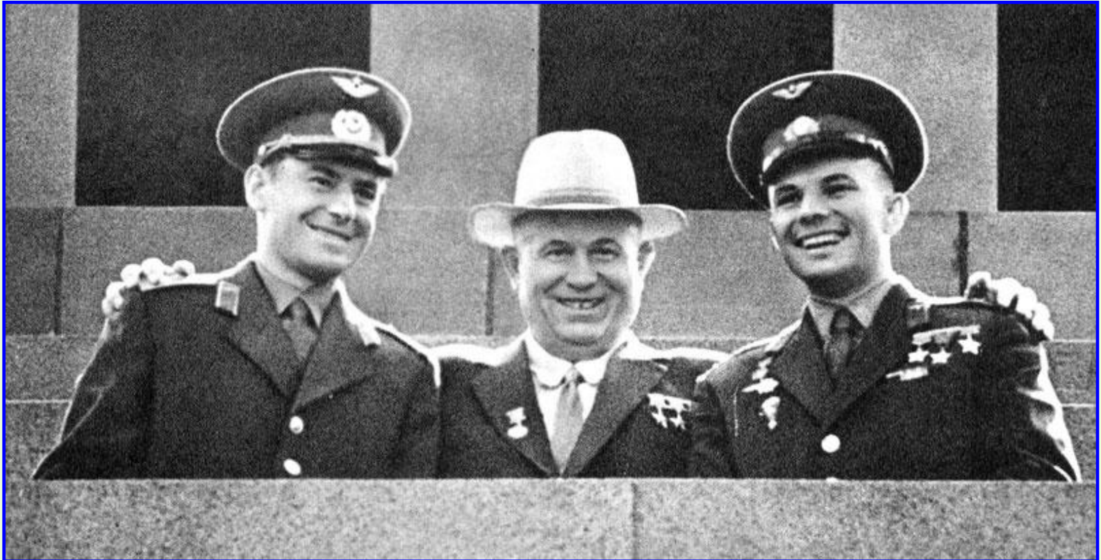
Г.Титов, Н.Хрущев, Ю.Гагарин