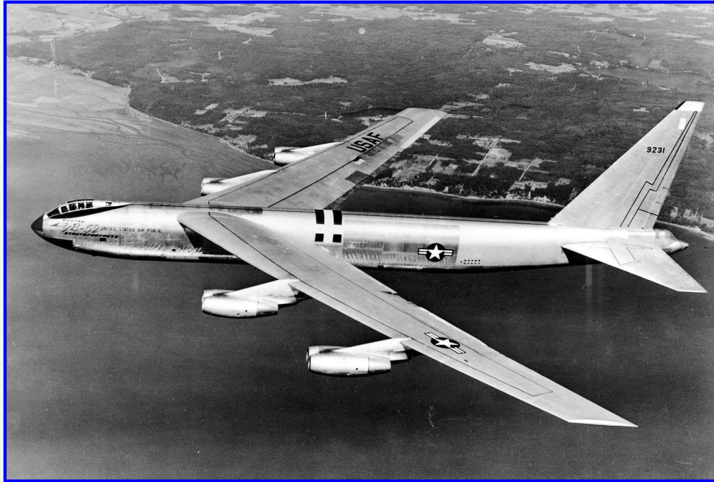
Американский стратегический бомбардировщик Б-52

Соперничество СССР и США вело к наращиванию вооружений ОВД и НАТО. Стороны стремились к превосходству в области атомного оружия и средств их доставки. В обеих странах появился военно-промышленный комплекс (ВПК), на нужды тратились огромные средства и работали лучшие научные силы. До 1949 г. лидерство в гонке принадлежало США, которые разрабатывали планы нанесения ядерного удара по территории СССР.