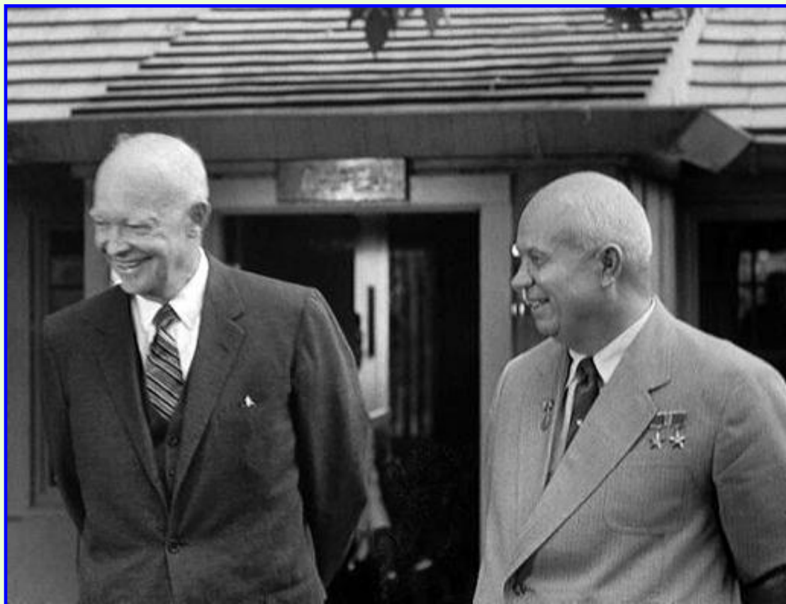
Президент США Д. Эйзенхауэр и руководитель СССР Н.Хрущев

Н.Хрущев в этот период не был заинтересован в конфронтации и в 1959 г. совершил визит в США. Это был первый визит руководителя СССР в США. США поразили Хрущева успехами в развитии сельского хозяйства и его высокой эффективностью.