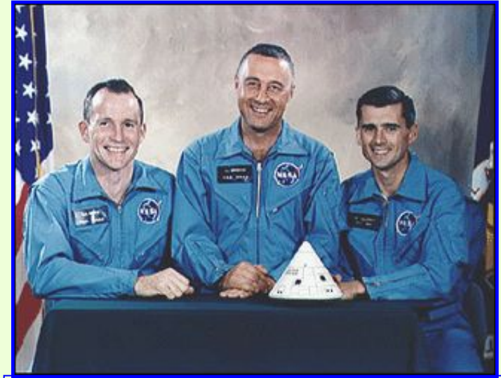
В.Гриссом, Э.Уайт, Р.Чаффи – экипаж «Аполлона-1»

Освоение космоса было рискованным и опасным делом. Часто в погоне за быстрым результатом пренебрегали техникой безопасности.