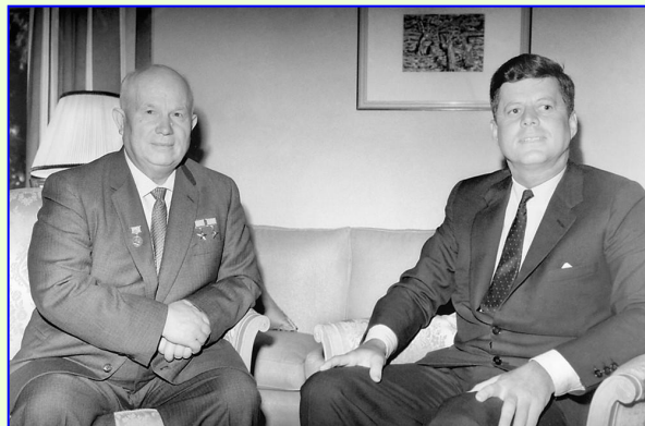
Н.Хрущев и Д.Кеннеди

1963 г. – договор о запрещении ядерных испытаний в трех средах.