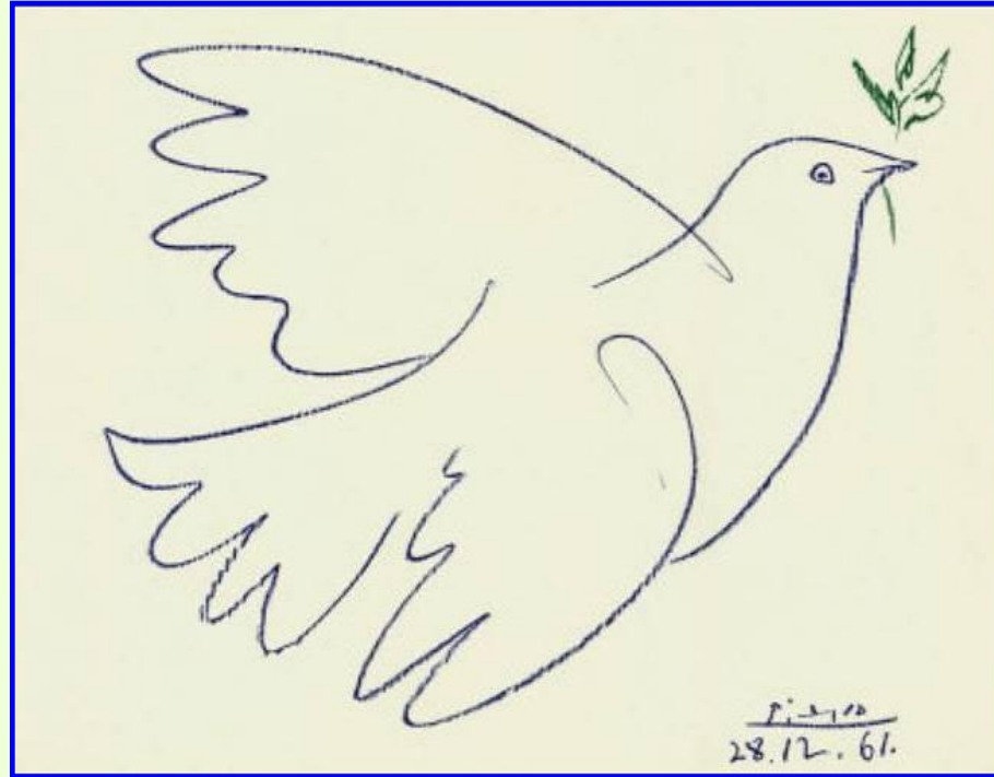
Голубь мира. П.Пикассо

В 1949 г. Советский Союз успешно провел испытание своей атомной бомбы. В 1952 г. американцы испытали термоядерное устройство. В 1953 г. СССР также испытал ядерное оружие. До 1960-х гг. США обгоняли СССР бомб и бомбардировщиков, но не по их качеству. Новый раскол мира и угроза третьей мировой войны вызывали протесты во всем мире.