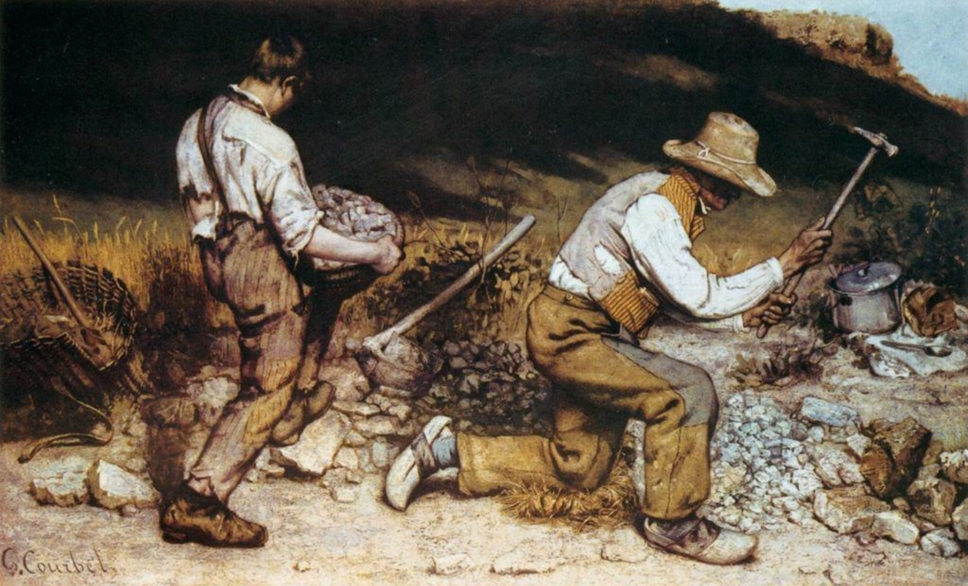
Реализм. Густав Курбе, Франция