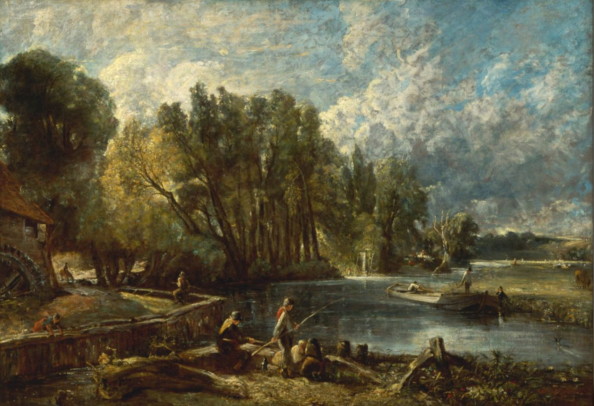
Романтизм. Джон Констебл, Англия