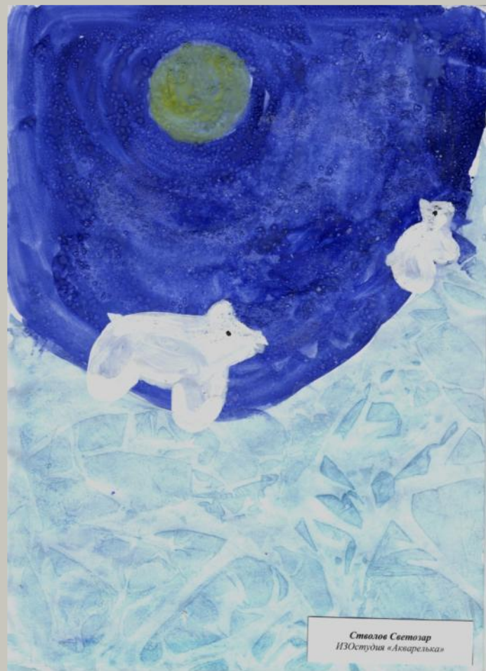
Светозар ИЗОстудия «Акварелька»

Различные техники прекрасно сочетаются между собой