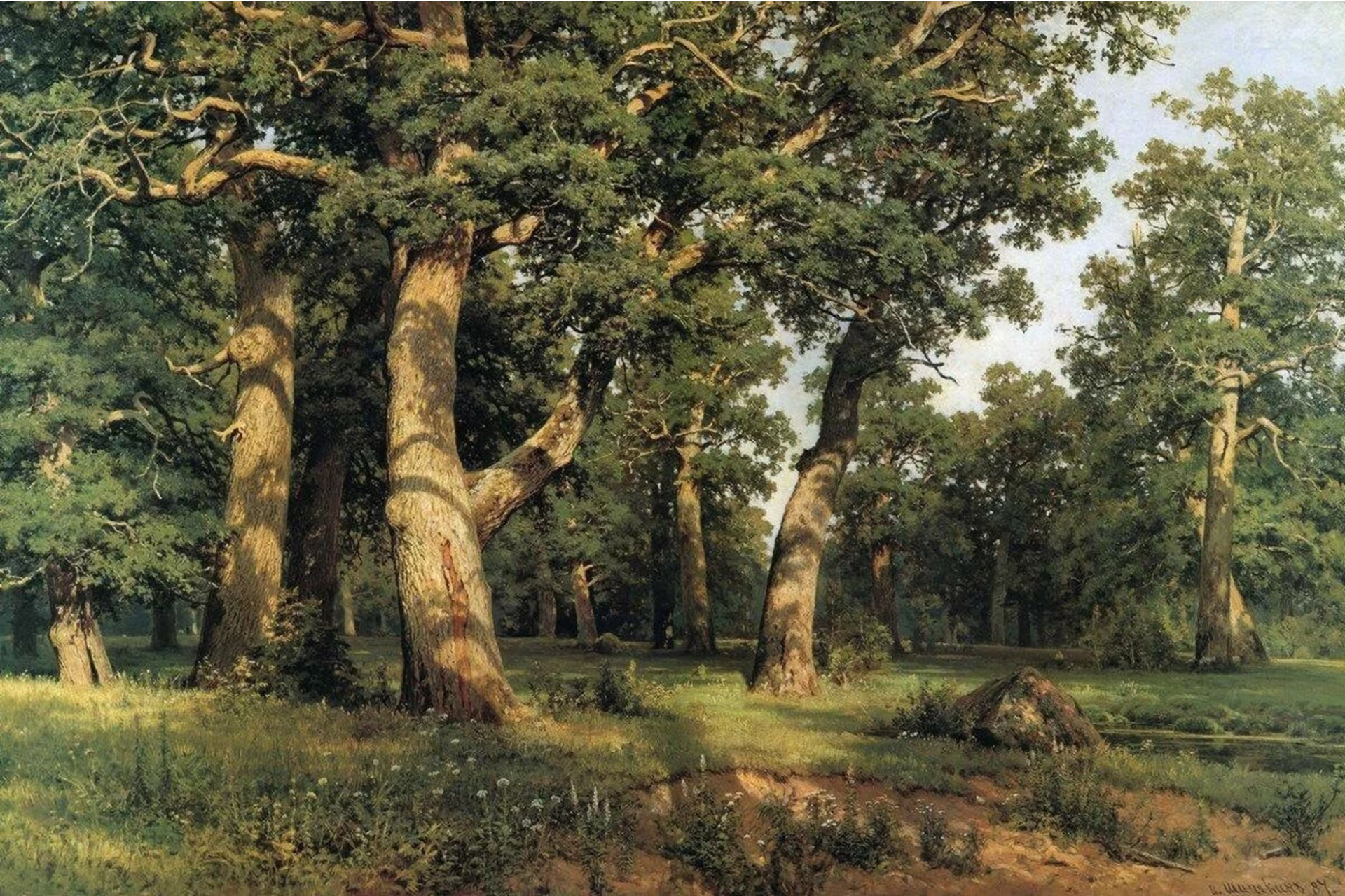
«Дубовая роща», 1887 год