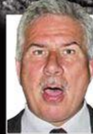
By VICKY SMITH