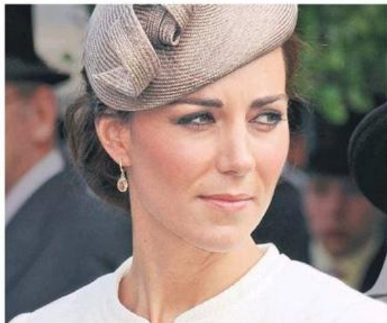
Kate Middleton may have been targeted by a private investigator before her marriage