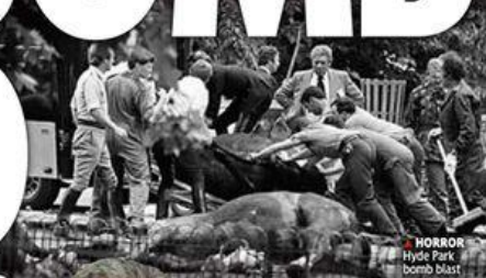
HORROR Hyde Park bomb blast