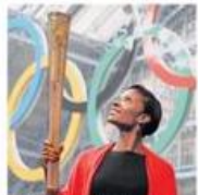
Medalist Denise Lewis shows off the torch at St Pauline's in London yesterday

Unveiling the design of the Olympic torch to be carried by 8,000 runners, London 2012 chairman, Lord Coe, admitted that the approved EDF had failed to come up with a workable low-carbon solution for the flame that will travel the country from May and light the Olympic cauldron on July 27.