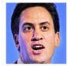
▲ BIG SPEECH Miliband