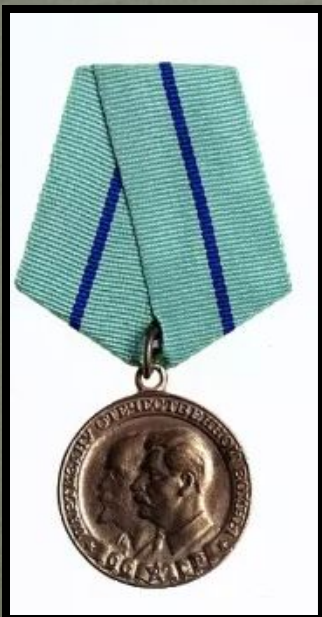
Медаль Партизану «Отечественной Войны, 2 степени»