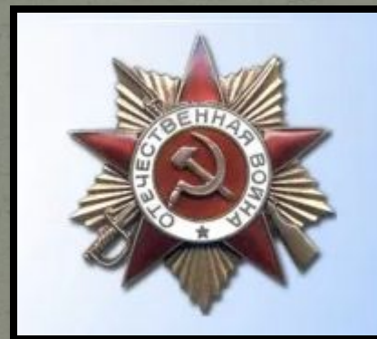
Орден Отечественной Войны, 1 степени