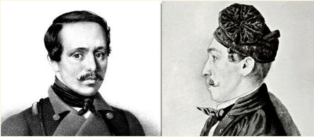
Михаил Лермонтов (слева) и Николай Мартынов (справа)

Лермонтов отличался очень резким нравом, любил подшучивать над остальными, дерзко выражаться в их сторону. После одной из подобных выходок Михаил Юрьевич схлестнулся в своей последней дуэли с Мартыновым.