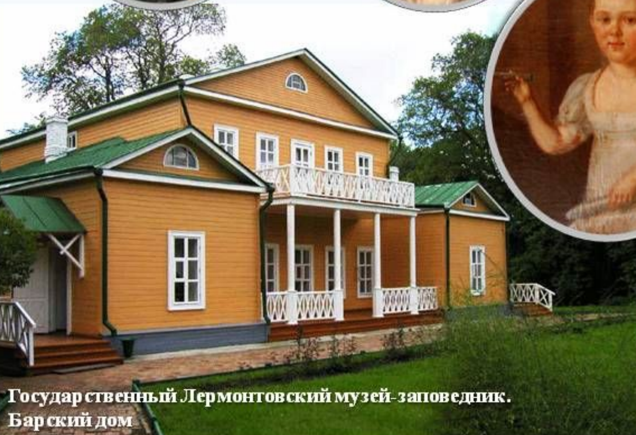
Государственный Лермонтовский музей-заповедник. Барский дом