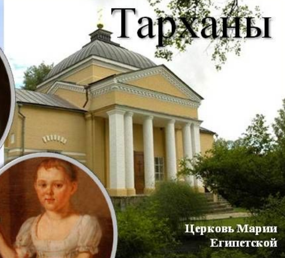
Церковь Марии Египетской