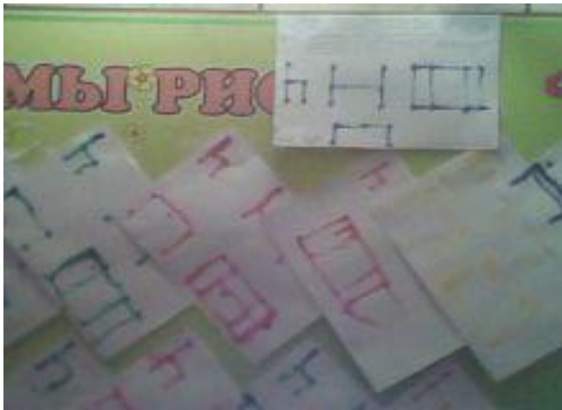
Точечный рисунок ватной палочкой