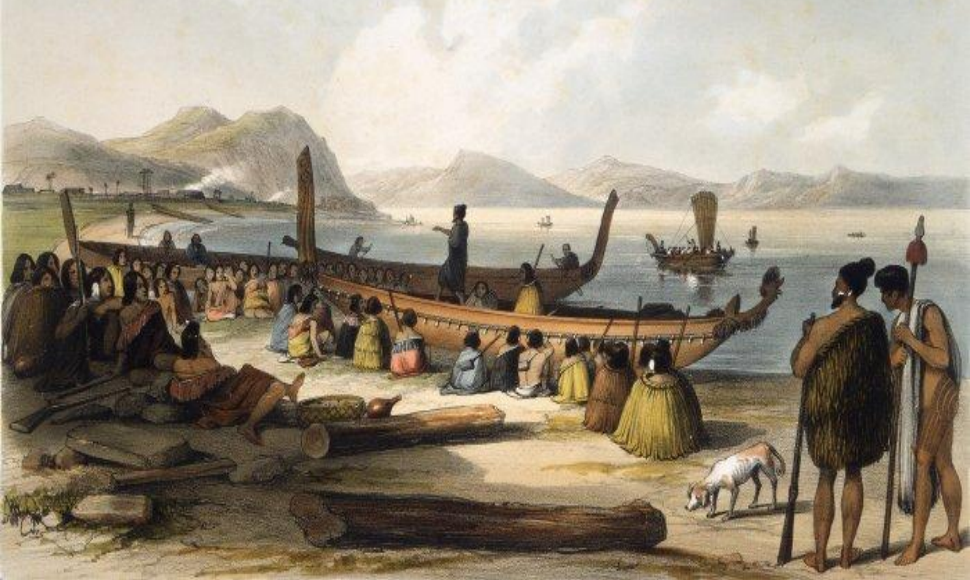
РИСУНОК КОНЦА XVIII ВЕКА