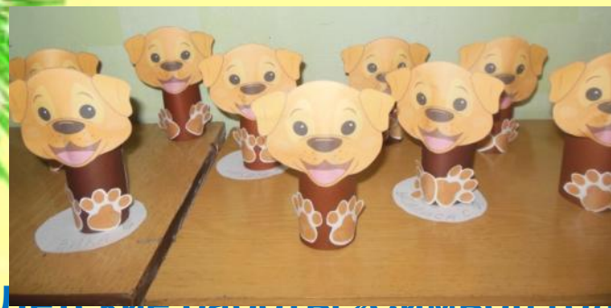
Детские работы «Символ года – Собака»