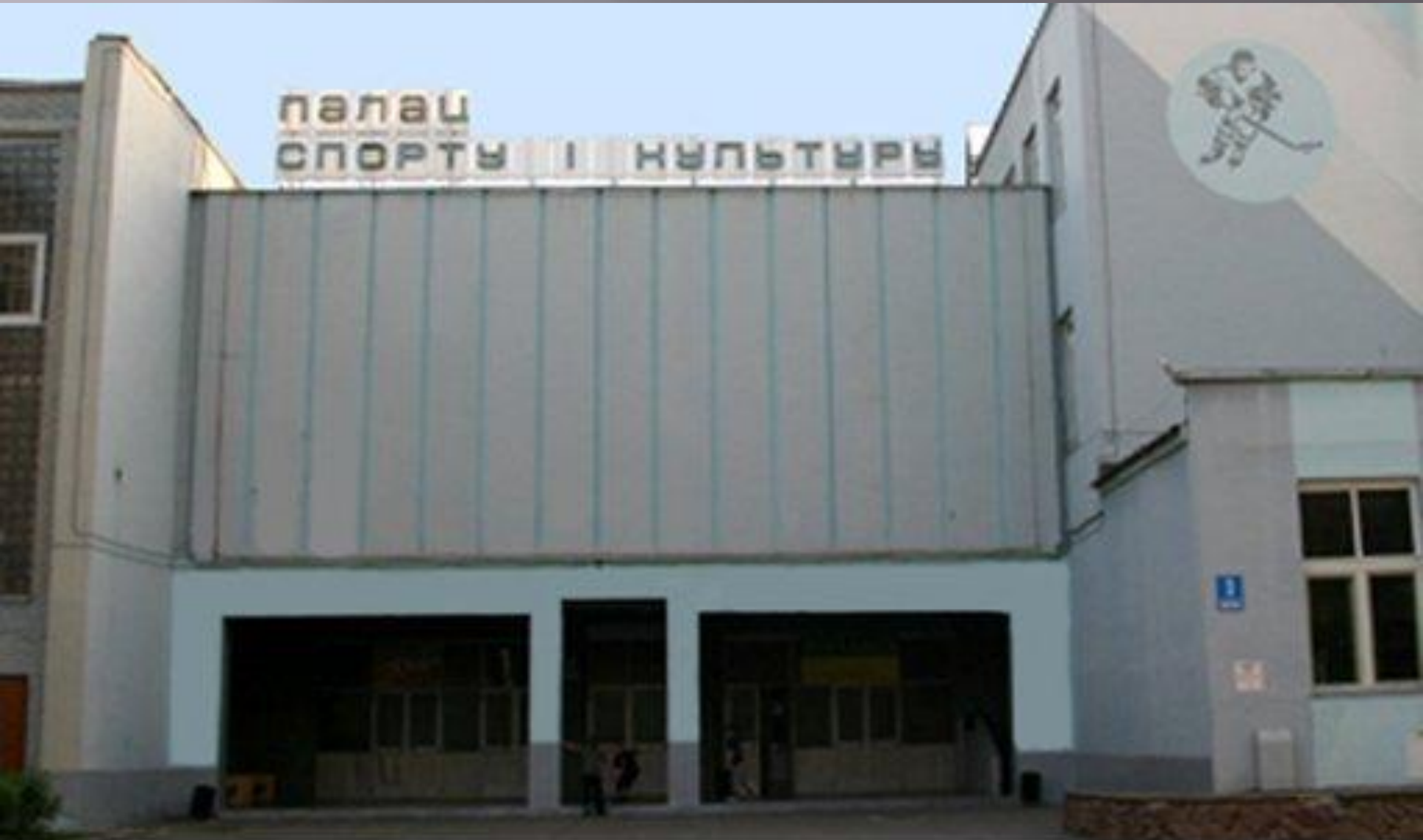
Дворец спорта и культуры в Новополоцке