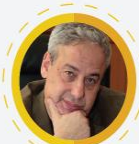
АСМОЛОВ Александр Григорьевич